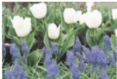
鮮やかな日蘭友好のチューリップ