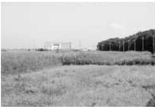
本市北西部に広がる新川耕地

新川耕地の有効活用を図るため、現在、市では「新川耕地有効活用計画」を策定しています。この計画に、多くの市民の皆さんの意見を反映させるため、九月八日に市民会議を開催します。 ぜひ、ご参加ください。 日時＝9月8日(土)14時～16時 場所＝文化会館 申し込み＝当日直接会場へ 問企画調整課 ☎50 6064