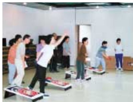
軽スポーツなどで楽しみながら体力づくりを

「体を動かしたい」「スポーツはしたいけど、一人では」と思っている高齢者の方を対象に、ストレッチや軽スポーツ等で、健康・体力づくりをするための講習会を開きます。この機会に、スポーツを楽しみ、健康づくりに役立ててみてはいかがでしょうか。