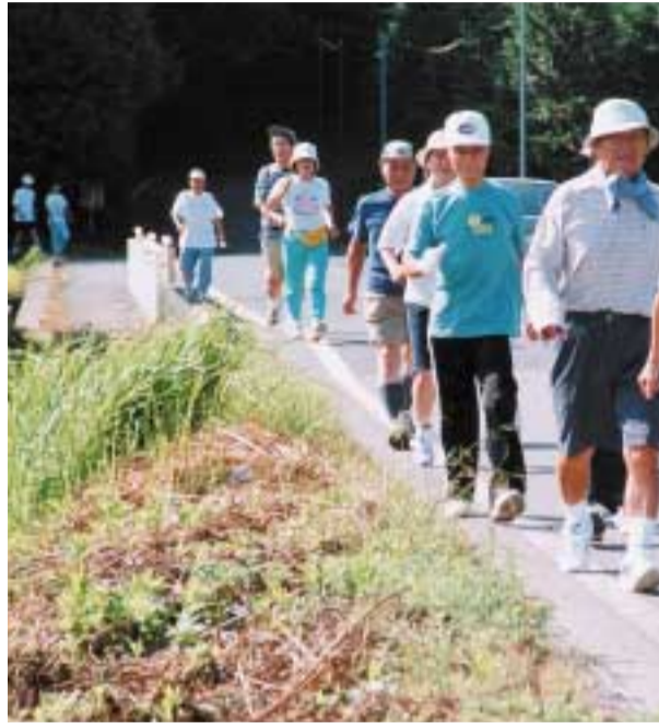
軽快な足どりジョギング講習会に参加する皆さん

生活習慣病の予防には、日々の食生活を改善することや十分な休養を取ることがもちろん大切ですが、ついにおろそかになるのが「運動」です。