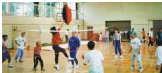
スポーツが苦手な方でも楽しめる催しに参加を