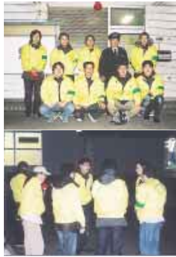
ボランティアグループ 「ピースライトハウス」 夜間パトロールでまち安心

「自分たちのまちは、自分たちで守ろう」を合言葉に、夜間パトロールを実施しているボランティアグループ「ピースライトハウス」。このグループは、平成12年に30歳代の15人が集まり、地域で何が出来るかを考え、地域の安全を守るため、南流山から東葛病院までの間を夜間パトロールすることからスタートしました。現在2班体制で28人が活動中で、南流山派出所のお巡りさんと協議し、重点地区を決めてパトロールをしています。「ピースライトハウス」の文字が入った黄色いジャンパー姿を見かけたら、声を掛けてください。