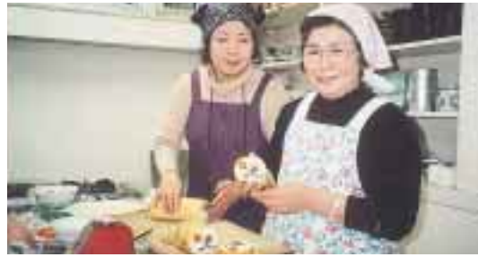
色鮮やかな花模様 太巻き寿司作りにチャレンジ!