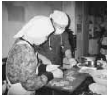
昨年の調理実習の様子