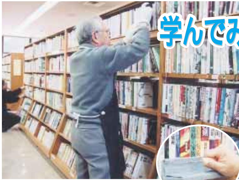
考案した道具を使って本を整理したり(上)、子どもたちに本の読み聞かせをする(左) ボランティアグループ「菜」の皆さん