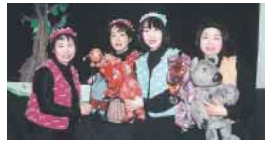
ボランティアセンターに登録している人形劇ピッコロ(上)、古切手などの収集ボランティアの皆さん(下)