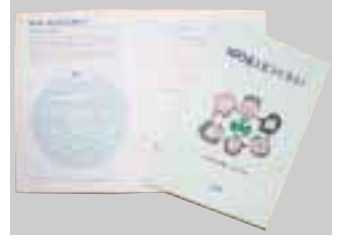
冊子を無料で配布中!