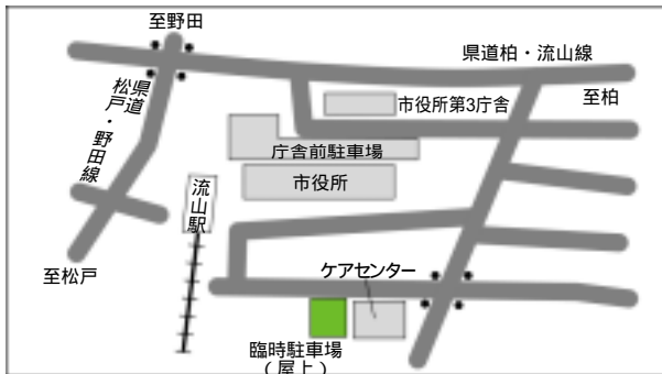
利用時間以外は施設しますのでご注意ください

また、市では臨時駐車場(下図参照)を開設していますので、申告などで駐車時間が長くなる方は、臨時駐車場をご利用ください。 臨時駐車場利用期間/利用時間：3月17日まで 8時30分～17時20分 問 管財課 ☎7150 6069