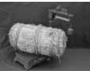
重い物を計るための台計り

企画展「ちょっと昔の暮らし」を市立博物館で、三月十六日まで開催しています。この企画展では、私たちの百年ほど前から十年ほど前までの暮らしを支えた道具などを展示し、「昔の暮らし」と「身のまわりの古い道具」の二つのコーナーに分けて展示しています。「昔の暮らし」のコーナーでは、暮らしの道具を衣食住の場面に分け、「身のまわりの古い道具」のコーナーでは、道具を使っていた人たちの思い出も紹介しています。なお、昔の道具を使って実際に体験できるコーナーも設けています。ちょっと昔に、タイムスリップしてみませんか。期間：3月16日(日)まで 毎週月曜、1月31日(金) 2月11日(祝)、28日(金)は休館 開館時間：9時30分～17時 入場料：無料 問 市立博物館 ☎7159-3434