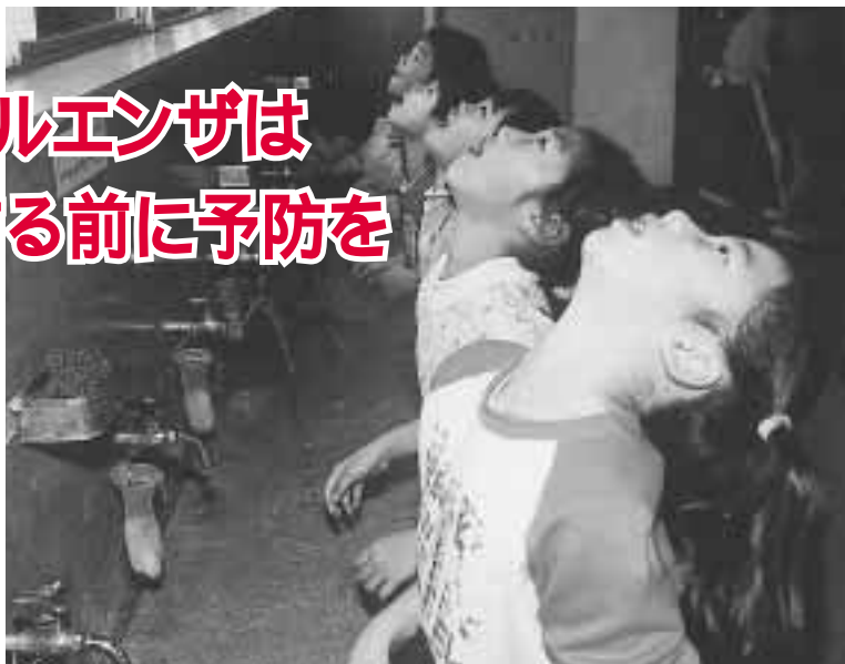
「外から帰ったら、しっかりうがいと手洗い」(流山北小学校1年生の子どもたち)

寒く空気が乾燥する冬は、インフルエンザが流行する季節です。インフルエンザは、患者のせきやくしゃみに含まれているウィルスを吸い込んで感染する場合と、床などに落ちたウィルスがほこりと共に舞い上がり空気中に漂い、それを吸い込むことによって感染する場合があります。インフルエンザにかからないためには、日ごろからの予防が大切です。インフルエンザが流行すると、短期間に乳幼児から高齢者まで多くの人を巻き込みます。体調に異変を感じたら、早めに医療機関で診療を受けたり、事前に予防接種を受ける(接種の際には医師に相談