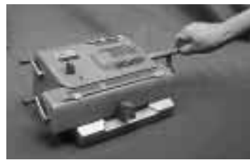
30年ぐらい前まで使われていた計算機

企画展「ちょっと昔の暮らし」を市立博物館で、三月十六日まで開催しています。この企画展では、私たちの百年ほど前から十年ほど前までの暮らしを支えた道具などを展示し、「昔の暮らし」と「身のまわりの古い道具」の二つのコーナーに分けて展示しています。「昔の暮らし」のコーナーでは、暮らしの道具を衣食住の場面に分け、「身のまわりの古い道具」のコーナーでは、道具を使っていた人たちの思い出も紹介しています。なお、昔の道具を使って実際に体験できるコーナーも設けています。ちょっと昔に、タイムスリップしてみませんか。期間：3月16日(日)まで 毎週月曜、1月31日(金) 2月11日(祝)、28日(金)は休館 開館時間：9時30分～17時 入場料：無料 問 市立博物館 ☎7159-3434