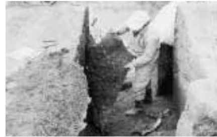
貝層を薬品で固めて、はぎ取る