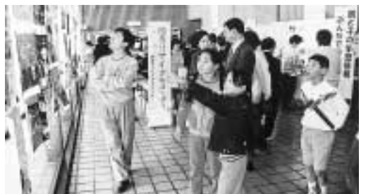
昨年度のまなびフェスタ

内容：各種イベント…生涯学習の情報閲覧できる情報提供コーナーや人形劇、ニコイスーツ体験コーナーなど。講演会…俳優・著述家や活躍中の沼田曜一（めまたよついち）さんを迎え、「人と人のつながり」をテーマにした講演会。参加費：無料。問生涯学習課 ☎ 7150-6106