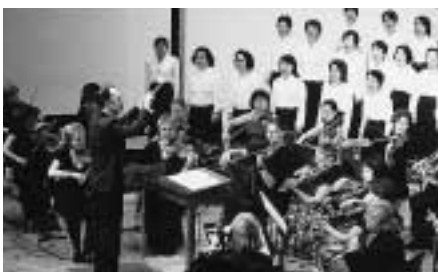
初めての国際文化交流コンサート

【公共施設間循環バス】 公共施設間循環バスについては、市内の公共施設等を利用する市民の足の確保を図るため、平成五年から運行をはじめ、年間約一万二千人のたくさんの方に利用されてい