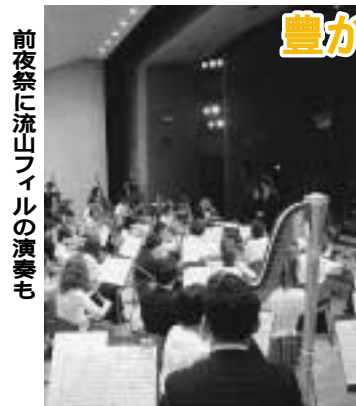
前夜祭に流山フィルの演奏も