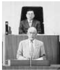
一般報告をする市長

市議会第三回定例会の冒頭、眉山市長は、十一項目について市政の一般報告を行いました。その項目は、「第四次流山市行政改革大綱と第二次財政改革指針の策定状況」、「総合防災訓練の実施」、「住民基本台帳ネットワークシステムの稼働」、「平成十三年度市税の徴収実績および個人県民税の徴収実績に係る千葉県知事表彰の三十二年連続受賞」、「新一般廃棄物処理施設整備事業および地域融和施設整備事業の進捗状況」、「ごみ焼却施設のダイオキシン類の測定結果」、「第二十七回流山花火大会」、「つくばエクスプレス建設の進捗状況」、「つくばエクスプレスの駅名」、「公共施設間循環バス」、「第五十二回流山市民芸術劇場「心の歌、世界の名曲」の開催」についてです。今号では、各項目の内容を要約して紹介します。