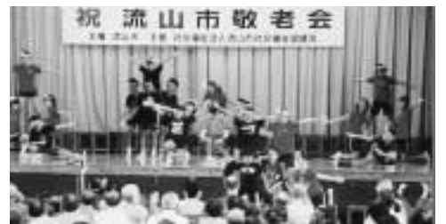
舞台上で元氣な踊りを披露する流山北小の子どもたち

九月八日に流山北小学校体育館で行われた敬老会(「写真」)では、同校の子どもたちの踊りや南都中学校フラスバンド部の演奏、地元老人クラブによる舞踊など、趣向を凝らした演芸が繰り広げられ、会場は、元氣なお年寄りの笑いと拍手で溢れていました。