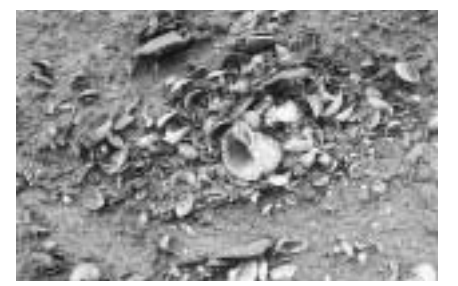
貝に混ざって土器片も見られる

発見も続いています。 台地上にあるほかの貝塚と異なり、第5貝塚は、台地の縁辺約三十メートルに貝層が斜面に堆積し、幅六メートル厚みが二メートルに及ぶ部分もありです。 これまでの調査で、縄文時代後期中ごろの土器や石器と共に出土するのは、多量の貝殻です。現在の食卓にも上るカキ、ハマグリ、アサリなどのほか、アカニシ、オキシジミ、シオフキといった海水域に生息する貝類を採集していたことがうかがえます。この貝殻のカルシウム分によって動物・鳥類・魚類の骨も良好