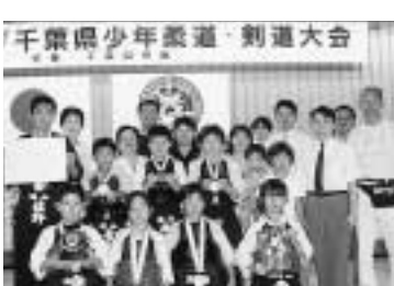
剣道大会で準優勝した子どもたち

タッチヤング活動で少年非行を防止 警察と少年たちが信頼関係を築く タッチヤング活動は、警察が地域の少年とのふれあいを通じて、お互いの信頼感を高め、少年自身の規範意識や自覚心などを育み、少年非行の防止を図ろうとする警察活動です。活動内容は、警察官が街頭で出会った少年に挨拶や声援を送り、お互いの信頼感を高める「明るい話しかけ活動」、警察官の見学や非行防止教室の開催、警察官と少年のスポーツ練習など少年との交流を深める「ふれあい広場づくり活動」、警察官などの道場を開放し、柔・剣道の指導を通じて規範意識や忍耐力を養う「少年柔・剣道活動」、街や道路の清掃、老人施設の慰問など、少年に社会の一員としての自覚や責任感を持たせる「社会参加活動」の四つが柱となっています。 七月二十五日、千葉県武道館で行われた第十八回タッチヤング千葉県少年柔道・剣道大会では、流山警察署少年剣道クラブの子どもたちが、準優勝になりました。 問流山警察署 ☎71590110