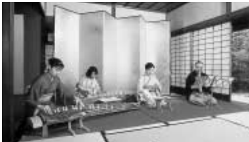
記念館で演奏する出演者の皆さん