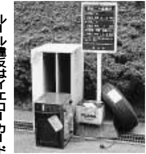
ルール違反はイエローカード