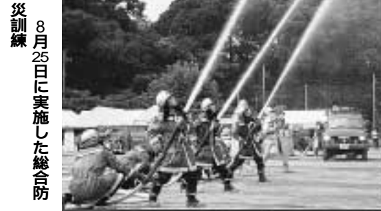
8月25日に実施した総合防災訓練

【住民基本台帳ネットワークシステムの稼働】 八月五日から住民サービスの向上と行政事務の効率化を図ることを目的に、市区町村の区域を越えた住民基本台帳に関する事務の処理や法律で定める国の行政機関等に対する本人確認情報の提供のためのネットワークシステムが全国一斉に稼働しました。このシステムの運用にあたり、全国民に付される本人確認のための十一桁の住民票コードについて、本市では、八月二十三日付けで全市民へ通知したところとす。また、来年八月から住民基本台帳カードの交付を希望する方への交付や、全国の市町村でも住民票の交付を受けられる第二次稼働が予定されていますが、これらの準備も含め、今後とも適正な運用に努めていきます。