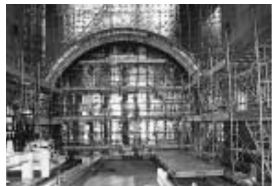
南流山駅の地下工事状況

ます。一方、総武流山電鉄との交差協議については、本市としての調停事件は終息していますが、六月二十五日に首都圏新都市鉄道株式会社と総武流山電鉄株式会社との間において第十八回調停が主任裁判官出席のもと、開かれましたが、残念ながら調停不調となつたとの報告を受けています。今後、つくばエクスプレスと総武流山電鉄との交差に関わる交渉について、同社と日本鉄道建設公団において任意の用地交渉が行われることとなりますが、この交