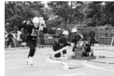
昨年の実戦消防操法大会より

新聞、ダンボール等紙類の資源ごみは、雨に濡れると資源として利用できなくなるため、雨の日を除いた収集日に出すか、資源物をビニール等に包んで出しましょう