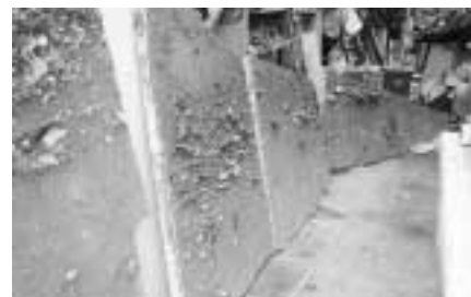
長大な標本は分割してパネルに

この長大な標本では、先ほど説明した遺物の出土状況や土そのもの、微細な貝・骨・炭・灰・焼土の様子などが生の状態で見ることが出来ます。何を埋め、何を食べる、どう捨てたのか。縄文人の生活が観察できる標本です。