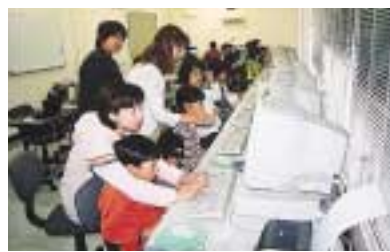
好評のパソコン講座

場所：文化会館 対象：定員10名 プロ機能などのキーボード操作ができる方/20人 費用：2000円(教材費など) ワード入門講習会 日程：9月12日・19日 10月3日・10日・17日(全5回) 時間：いずれも木曜 時間：いずれも13時30分～15時30分 場所：文化会館 対象：定員10名 費用：1500円(教材費など) 広報づくり入門教室 日程：9月12日・19日、10月3日・10日・17日(全5回) 時間：いずれも10時～12時