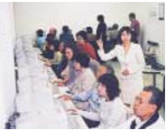
好評を得たIT講習会

国のIT革命計画の一環として、パソコン初心者を対象に昨年四月から一年間IT講習会を開催したところ、二百三十六講座に約五千二百人の市民が受講され、盛況のうちを終了し、受講者から好評を得ることができました。