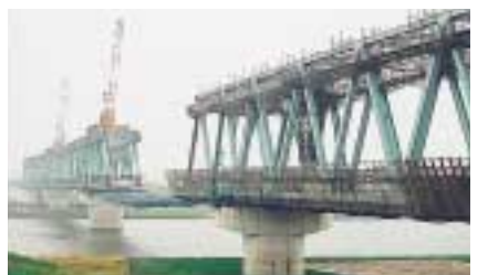
間もなく完成予定の江戸川のトラス橋工事

つくばエクスプレスは、平成十七年度開業に向けて、全線が工事が進められています。現在、つくばエクスプレスの鉄道用地は、九十九パーセントが確保され、土木工事の進捗率は、四十八パーセントです。なお、市内の鉄道用地は、おおむね確保されていますが、引き続き関係機関と連携し、協議を進めていきます。