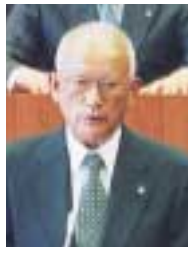
一般報告をする 眉山市長

市議会第二回定例会の冒頭、眉山市長は、十三項目について市政の一般報告を行いました。その項目は、「IT講習会の実施報告」、「議員海外視察研修の訴訟経緯」、「つばさ学園療育相談室の開設」、「障害者自立支援の諸施策」、「ファミリー・サポート・センターの活動状況」、「老人保健施設「ナッシングプラザ流山」併設の診療所開設計画の断念」、「江戸川クリーン大作戦および春季ごみゼロ運動の実施状況」、「第二期ごみ減量・資源化行動計画の推進」、「新一般廃棄物処理施設整備事業および地域融和施設整備事業の進捗状況」、「つくばエクスプレス建設の進捗状況」、「つくばエクスプレスの駅名および駅舎デザインに関する市民の意見聴取結果」、「新教育課程における総合的な学習の時間の実施」、「市消防団長の退任および就任」についてです。今号では、これらを要約して紹介します。