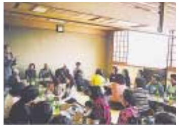
ファミリー・サポート・センター会員の交流会

ファミリー・サポート・センター開設時の会員数は八十七人でしたが、四カ月後のことし四月には利用会員七十九人、提供会員百十八人、利用・提供の両方会員六人の合計二百三十三人と急成長しています。