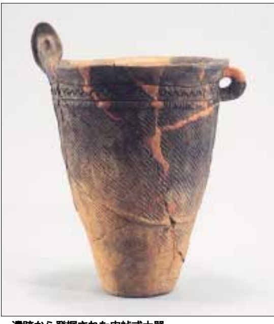
遺跡から発掘された中峠式土器

市立博物館では、七月十三日から九月十四日まで企画展「市内最大の縄文集落 中野久木谷頭遺跡」を開催します。流山市は、下総台地の西端に位置し、台地上からは多くの遺跡が発見されています。特に縄文時代には、海進により