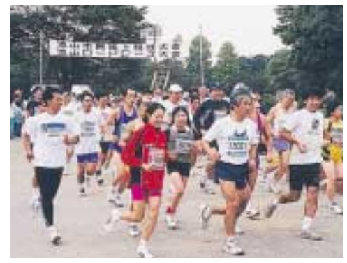
昨年の流山ロードレース大会から

「第十一回流山ロードレース大会」が、十月十三日に開催されます。大会実行委員会では、参加者を募集しています。 日時:10月13日(日)11時スタート コース:市総合運動公園周回コース(10キロ) 種目:一般男子 一般女子 40歳代男子 40歳代女子 50歳代男子 50歳以上女子 60歳以上男子 高校男子 高 校女子 おおむね70分で完走できる方 参加費:3000円 申し込み:市民総合体育館、公民館にある参加申込用紙(郵便振替用紙)に必要事項を記入し、参加費を添えて8月20日(消印有効)までに郵便局で申し込みを 賞品:各種目6位まで記念品と賞状(参加者全員にTシャツ) 問スポーツ振興課 71591212