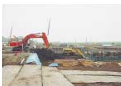
ごみ焼却施設の建設状況

なお、現在、基本設計等に向けて準備を進めています。市民や議会からの提言等も考慮しながら取り組んでいきます。