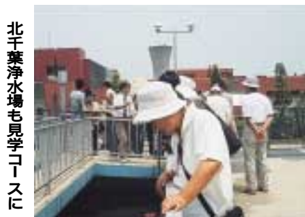
北千葉浄水場も見学コースに

市内施設見学会を今月十六日に開催します。私たちがふだん、何気なく使っている水や家庭で出したごみ など日常生活にかかわりのある市内の施設、北千葉浄水場や清掃事務所などをバスでぐるりと見学します。 期日=5月16日(木) 雨天 決行 集合場所/時間=江戸川台駅西口時計台前/8時45分 文化会館/9時 東部公民館/9時25分 見学先=ナーシングプラザ流山(老人保健施設) 流山工業団地 清掃事務所 北千葉広域水道企業団 対象/定員=市内在住の方/30人(先着順)