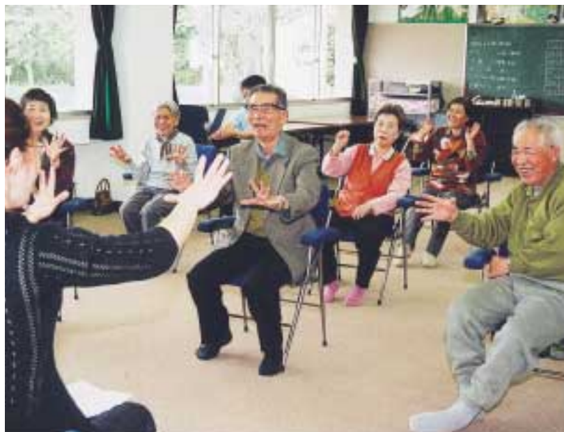
理学療法による機能回復訓練