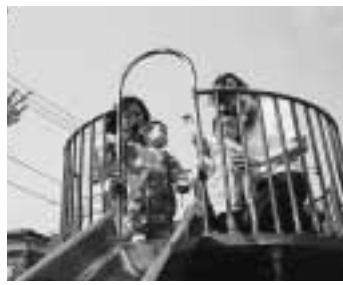
公園で元気に遊ぶ子どもたち

義務教育就学前の児童を養育している方を対象に、児童手当を支給しています。この手当は、随時申請を受け付けますが、申請をしないと支給されませんので、対象になる方は忘れずに手続