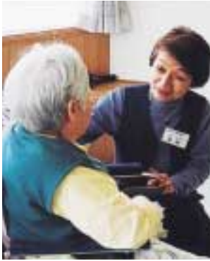
施設を訪問し、お年寄りの相談を受ける介護相談員

高齢者の介護サービスを利用する方の疑問や不安、意見を耳を傾け、利用者やサービス提供者と市との橋渡し役となる「介護相談員」を募集します。