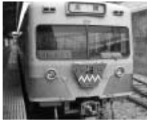
総武流山電鉄「流山駅」