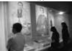
本陣を敷いたと言われる長岡屋階段