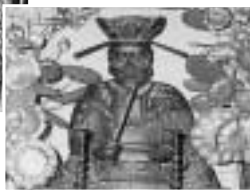
江戸時代の閻魔王坐像を祀ってある閻魔堂(土・日曜、祝日に公開日あり)