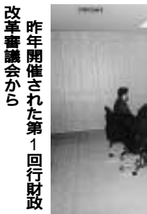
昨年開催された第1回行政改革審議会から

国民年金に加入している学生で収入がないため、保険料を納められない場合は、学生納付特例制度の申請手続きをすると保険料の納付が猶予されます。