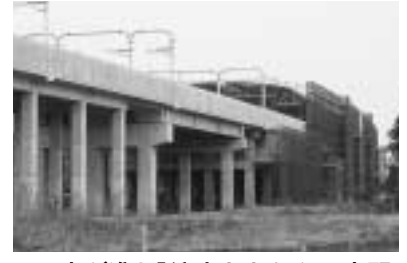
工事が進む「流山おおたかの森駅」周辺

平成十六年度は、第一に、本市の持つ可能性を限りなく引き出すため、つくばエクスプレスの開業とこれに