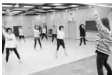
さまざまな市民活動の場を提供する公民館

平成十六年度は、総合計画に位置付けられる前期最終年度であり、また、今後五年間の市政運営の指針となる「下期事業計画」の策定年度です。そこで、今後の行政展開の基本的な方向、個別の施策・事業展開については、本年秋季までに素案を固める下期五カ年事業計画策定の中で、市民、議会の意向を充分踏まえ、全職員の英知を集めて庁内に策定に努めていきたく考えています。