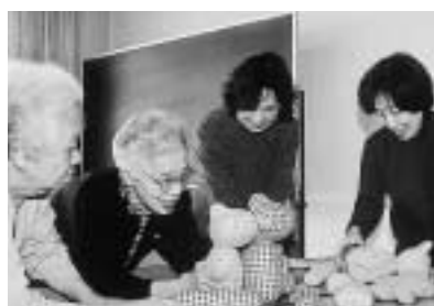
公民館で好きな手芸を学ぶ皆さん