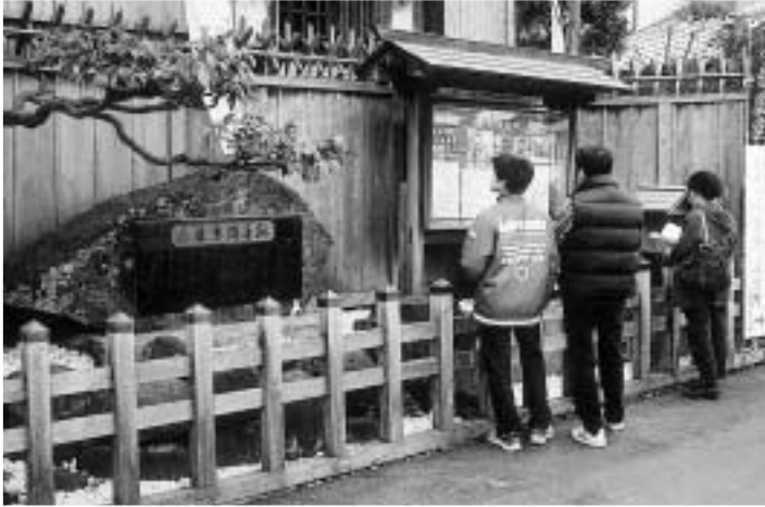
当時、醸造家「長岡屋」があったこの場所に、近藤勇は最後の陣を敷いたと言われている