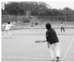
多くの市民が利用するコミュニ ティプラザのテニスコート

流山勤労者体育施設屋内 テニスコートおよび流山コ ミュニティプラザのテニス コートの人工芝の老朽化に 伴い、全面張替工事を実施 します。