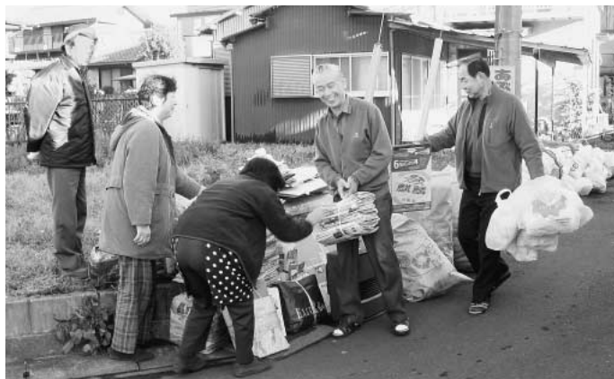
早朝からリサイクル活動を行う西初石6丁目自治会の皆さん

炭酸カルシウム入り指定ごみ袋の廃止により、ごみの分別がなくなる訳ではありません。昨年四月、リサイクルプラザのオープンを機に、プラスチックやペットボトルなどの新たな品目がリサイクルされるようになりました。また、昨年四月から九月までの資源ごみを含む