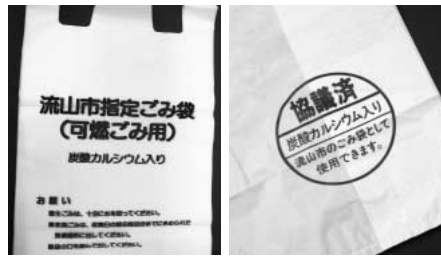
3月末日で廃止となる炭酸カルシウム入り指定ごみ袋(左)と協議済袋(右)

本市の炭酸カルシウム入り指定ごみ袋は、このす台にある清美園の焼却炉の損傷を軽減するために、焼却熱量を抑える炭酸カルシウムを混入した燃やすごみの袋ですが、現在、試験運転中の新ごみ焼却施設は、ごみの高温燃焼処理ができ、焼却熱量を抑える必要がなくなることから、炭酸カルシウム入り指定ごみ袋および同様の成分を持つ協議済袋を廃止することに