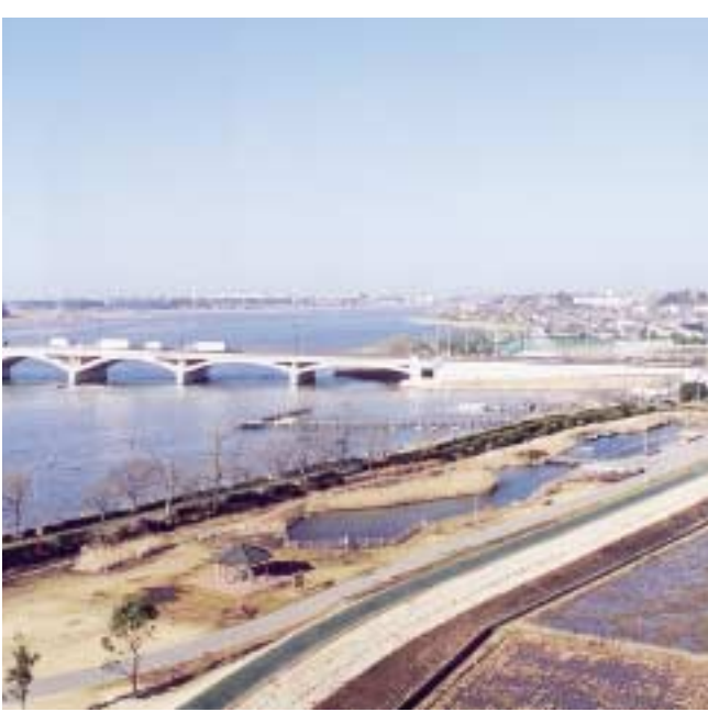
我孫子のシンボル手賀沼

コーディネーター 今後この街づくりの展望は？ハード面、ソフト面など、具体的なビジョンに加えて、将来の夢をお話してください。 流山市長 流山は首都圏から近く、自然に恵まれ、つくばエクスプレスも開通 するところであって、大変な潜在能力・可能性を持つ市です。私は、この可能性をしっかりと引き出す街づくりを進めていきたいと思っています。 そのために、十月にマーケティング室を設置し、平