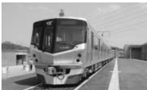
つくばエクスプレス

ほど公募させていただきましたが、素晴らしい見識と専門性を持った方々が多数応募してくださいました。ケネディの言葉に「市が、国が何をしてくれるかではなくて、何ができるか」とい