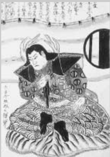
戦友姿絵「近藤勇」