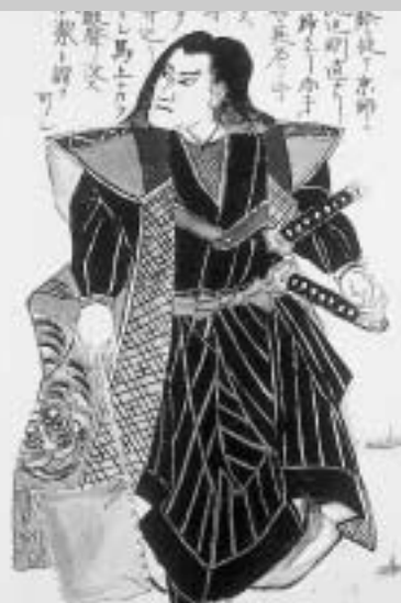
戦友姿絵「土方歳三」

近在の者までもが皆あわて騒ぎ、共々に難渋した」とあります。 新選組は慶応四年一月の鳥羽・伏見戦争で敗れて江戸へもどり、その後甲陽鎮撫隊と改名して勝沼で戦いますが、これにも敗れてしまっ