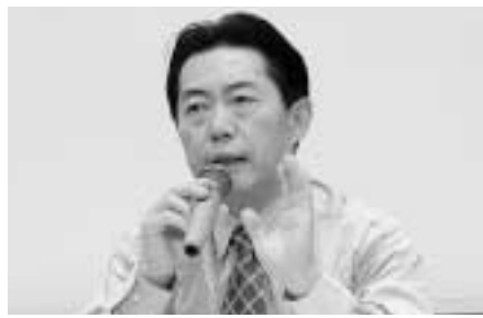
井崎義治流山市長