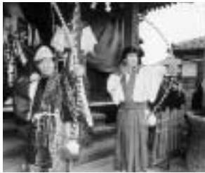
見学は地元の方の迷惑にならないよう、マナーを守ってください

成人を迎える方々の門出を祝う、成人式「二十歳を祝うつどい」を、今月十二日・午前十時三十分(受け付けは午前十時)から文化会館で開催します。