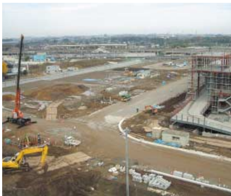
開発中の新鎌ヶ谷駅周辺

これらを中心に「行財政改革推進のためのアクションプラン100」を作りました。このコンセプトは、行政と市民の協働です。また、公務員の給与制度に業績評価、能力評価の導