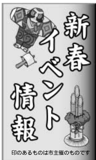
印のあるものは市主催のものです

当日は、参加者全員に記念品が贈られます。対象の方には、すでに案内状を送付しましたが、届いていない方や紛失してし