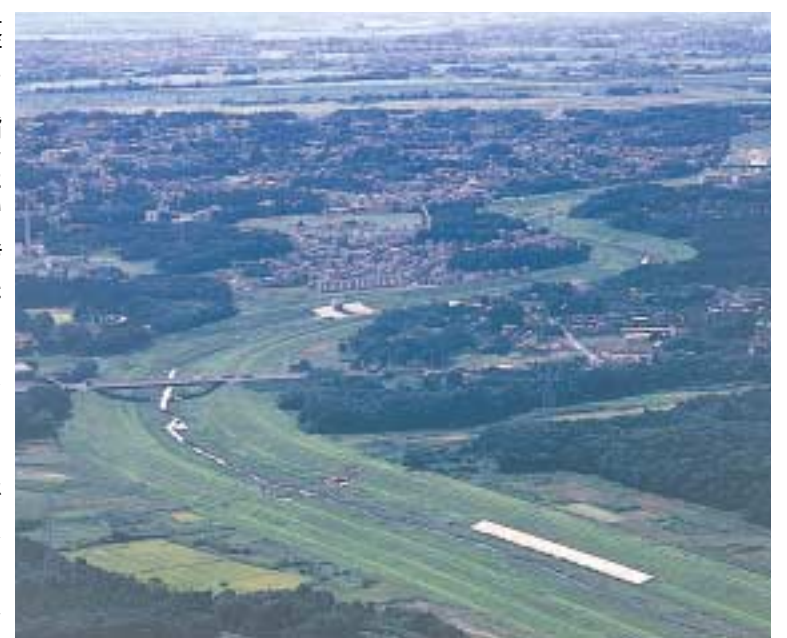
曲線が美しい利根運河

また、実態が分からない会計システムになっっていることや職員の計画的採用を含めて、計画的に財政に反映されていないなど問題があります。