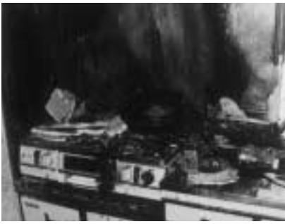
天ぷら油から出火した台所火災

など燃える物を置かないようにしてください。 期間中は、消防署、消防団が火災予防を呼び掛けます。また、十一月九日、朝七時に予防運動を知らせるためのサイレンを鳴らします。