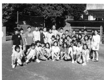
▲みんなそろってハイ、チーズ