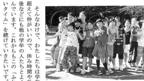
▲元氣いっぱい六年生です。