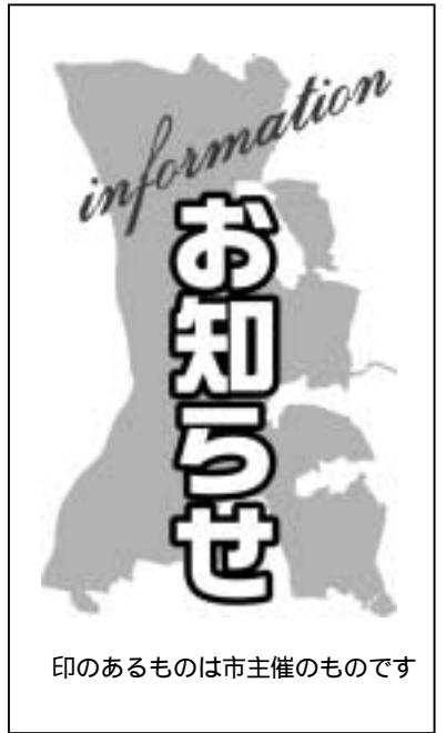
印のあるものは市主催のものです