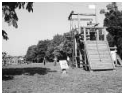
やまびこ公園と呼ばれている東部近隣公園