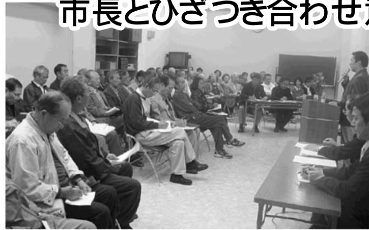
10月26日に東部公民館で行われたタウンミーティング