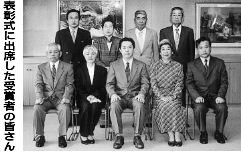
表彰式に出席した受賞者の皆さん