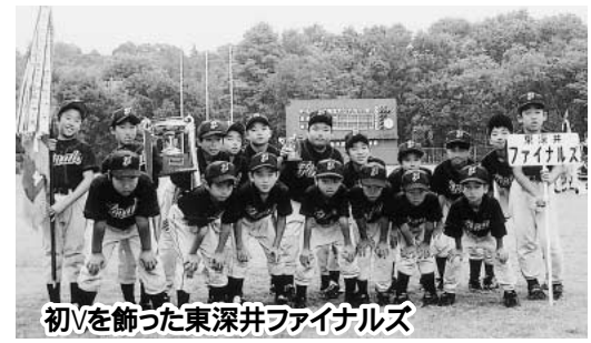
初Vを飾った東深井ファイナルズ

第五十四回流山市少年野球秋季大会が、九月二十八日から十月十三日にかけて行われ、市総合運動公園などを舞台に熱い戦いが展開されました。十八チームが参加したAクラス(小学6年生以下)では、長崎FLBが春季大会に続き連覇。十一チームが参加したBクラス(小学4年生以下)では、東深井ファイナルズが念願の初優勝を成し遂げました。