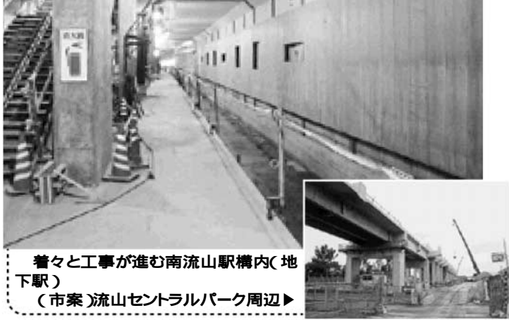
着々と工事が進む南流山駅構内(地下駅) (市案)流山セントラルパーク周辺

(社)流山青年会議所では、小・中学生をはじめとする市民の皆さんに「つくばエクспレス」について知っていただくため、十月十八日に「つくばエクспレス