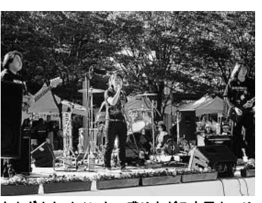
さまざまなイベントで盛り上がる市民まつり

八月末現在のごみ焼却施設建設工事の進捗状況については、建築およびプラント機器工事を合わせ、約八十四パーセントの進捗率となっています。また、九月初めには、予定どおり受電を開始しました。十月からは、無負荷運転に入り、十一月からは負荷運転に入り、各種の性能試験等を経て平成十六年二月末には竣工し、平成十六年四月から本稼働できるものと考えています。