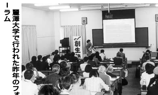
麗澤大学で行われた昨年のフォーラム

まちづくり創生塾は、「財政とつくばエクスプレス分科会」、「まちづくり(緑と水)分科会」、「高齢者福祉分科会」、「地域の教育を考える分科会」、「人材