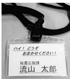
一回り大きく、見やすく

「名札が小さくて見えにくい」という市民の皆さんの声にお応えして、市では、今月一日から職員の名札を大判化し、見やすいものになりました。