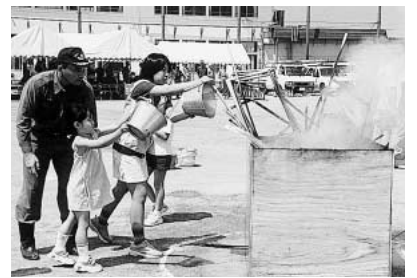
訓練に真剣に取り組む参加者

本市では、一小学校区一学童保育所を目標に施設整備を進めています。九月に東小学校区の児童を対象とした、学童保育所を同小学校内に設置しました。これは、東小学校の余裕教室を改修して新たに開設したもので、十五の小学校区に対して学童保育所は十