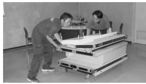
市役所内分煙施設の撤去作業

市では、七月一日から市役所などの公共施設を禁煙としました。ご協力をお願いします。