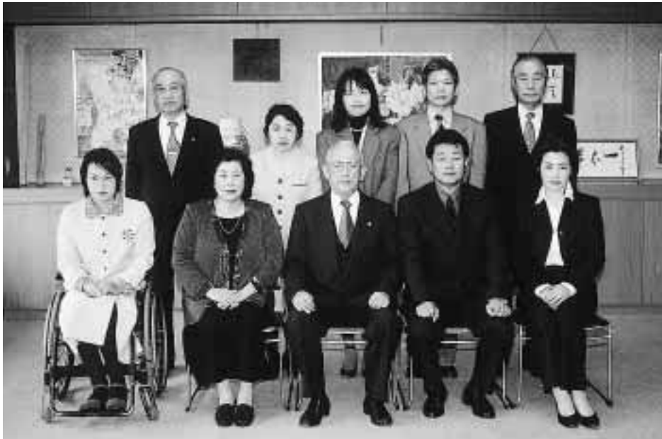
表彰式に出席した功労者の皆さん

市観光協会では「第32回観光写真コンクール」の作品を募集します。インスタントカメラ、デジタルカメラで撮影した作品も大歓迎。ぜひ、ご応募ください。 テーマ=「流山観光スポットTOP30」の30カ所(広報ながれやま2月1日号参照)または姉妹都市(福島県相馬市・長野県信濃町)に関する風景、イベント、まつり等を被写体としたもので、観光宣伝に効果のあるもの 応募規格=カラープリント4ツ切判(254mm×305mm)またはA4判(210mm×297mm) 4ツ切ワイド不可 応募規定=平成14年6月以降に撮影した未発表の自作品(1人3点以内) 応募作品の著作権は主催者に帰属 応募方法=所定または自作の応募票に、題名、氏名、年齢、郵便番号、住所、電話番号、撮影場所・日時、デジタルカメラで撮影した作品は「デジカメ撮影」と明記し、応募作品の裏面に張りテ270 0192 流山市役所商工課内観光協会事務局へ郵送または持参 受付期間=5月1日~6月30日(必着) 問 商工課内観光協会事務局 ☎7150 6085