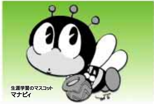
生涯学習のマスコット マナビ

このガイドは、平成15年4月から9月までに開催を予定している生涯学習に関する事業を掲載したものです。今後の生涯学習活動の目安にぜひご活用ください。なお、天候や会場、講師の都合等により、開催期日、内容等が変更される場合がありますので、詳しい内容は申込方法等と合わせて、問い合わせ先で事前に確認してください。また、事業の性格上、既に申し込みの終了している事業もありますが、今後の生涯学習の参考としていただくために掲載しています。