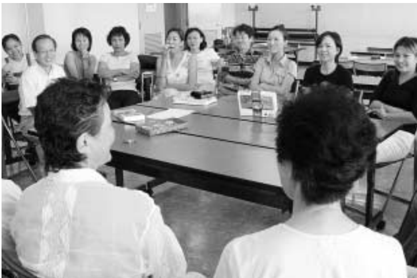
さまざまな分野で活発な活動が展開されている公共施設

抽選結果の確認、取り消し、予約の申し込み、予約状況の確認、取り消し、空き状況の案内、施設の案内など。