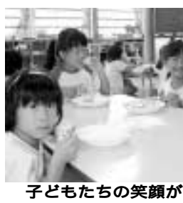
子どもたちの笑顔が一番

「流山セントラルパーク」から「南流山駅」までの約二・二キロを自由に歩いていたが、つくばエクスプレスの開業を機に、つくばエクスプレス沿線整備事業を推進する沿線自治体への財政支援に関する要望書」を直接手渡しました。