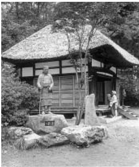
一茶ゆかりの地・信濃町で俳句を