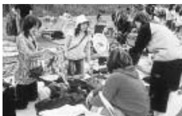
使わなくなったものもガレージセールでリサイクル

「大量廃棄、大量リサイクルからの脱却」「環境負荷の少ないごみ処理システム構築」、生活排水処理計画では「公共下水道を中心とした生活排水