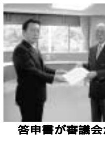
市長が審議会から答申書を受け取る様子

流山市民まつりについて 市民まつりについては、今年で二十六回目を迎え、本年度も市民まつり実行委員会の主催により、市民相互の連帯意識の高揚と郷土愛の育成を図ることを目的に、福祉まつりと健康まつりの合同開催により、十一月三日、総合運動公園において実施します。