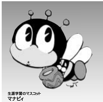
生涯学習のマスコット マナビ