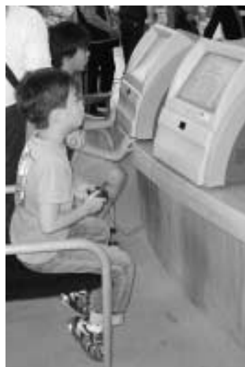
利用者用開放端末機は市内3カ所に設置

利用者用開放端末機は、自由に操作して、抽選申し込みや空き状況などを調べることができま