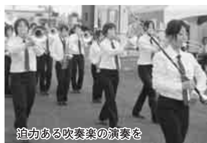
迫力ある吹奏楽の演奏を

分)・野田市立第一中学校(15時) ※演奏開始時間は変更になる場合があります▽入場料▽無料