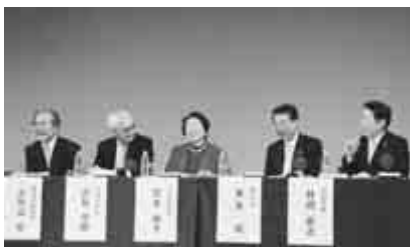
シンポジウムで官学連携

沿線地域における世界レ ベルの研究機関の活動を 活かした「国際学術都市 づくり」についての提案 がありました。