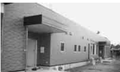
今春オープンのかまぎ園

駒木台の市有地に建設 を進めていました障害者 の就労継続支援B型施設 「流山こまぎ園」が完成し、 本年3月のオープンに向 けて準備が進められてい ます。この就労施設は、 障害者がスーパリーの買 物かごの洗浄などの作業 を行う施設で、社会福祉 協議会の直営施設として は、県内初となります。