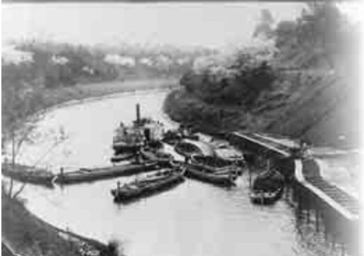
運河橋から利根川方向を望む。上を横切るのは県営鉄道(現・東武野田線)の鉄橋。(大正4年4月撮影)