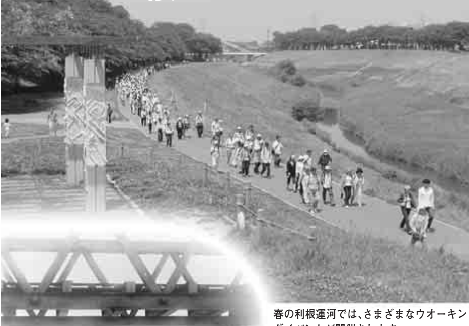
春の利根運河では、さまざまなウォーキングイベントが開催されます