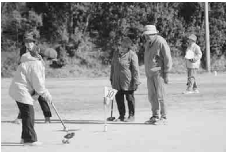
健康都市宣言の街にふさわしく生涯スポーツの施設整備も進む