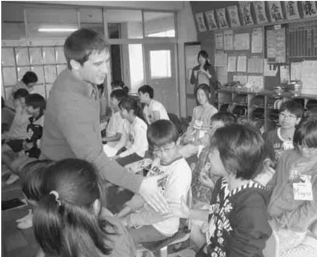
国際理解を深める英語教育を推進(向小金小学校で)