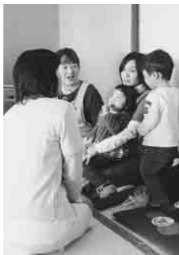
専門家による健康推進事業も充実