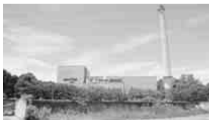
旧清美園の焼却施設(このす台)