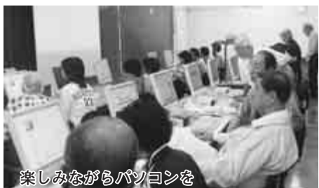
楽しみながらパソコンを

ワード中級講座(全2回) 〇期日 〇3月18日(火) 〇19日(水) 〇時間 〇13時30分~16時 〇場所 〇文化会館 〇対象/定員 〇「ワード入門・ステップアップI講座」修了