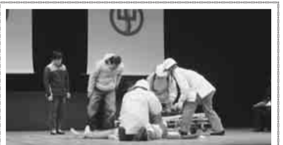
出初式でAEDの使用法を学ぶ

1月12日、文化会館で消防出初式が行われ、消防団員など関係者約600人が参加しました。救急隊によるAED(自動体外式除細動器)を用いた応急手当の訓練が披露されました。消防本部では、救急隊によるAEDを取り入れた「普通救命講習会」を開催しています。中央消防署 ☎7158-0266 / 北消防署 ☎7152-0119