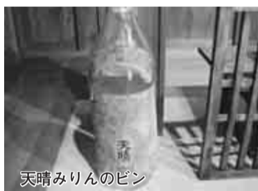
天晴みりんのピン

時代を偲ばせる同記念館で開催するもの。流山のみりんは、江戸から関東一円に広まり、天晴みりん、万上みりんは、1873年のウィーン万国博覧会にも出品され、有功賞牌を授与されるなど、江戸後期から明治にかけて、