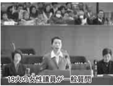
19人の女性議員が一般質問

女性の管理職登用など女性の視点での質疑も数多く行われ、満席の傍聴席では、市民の皆