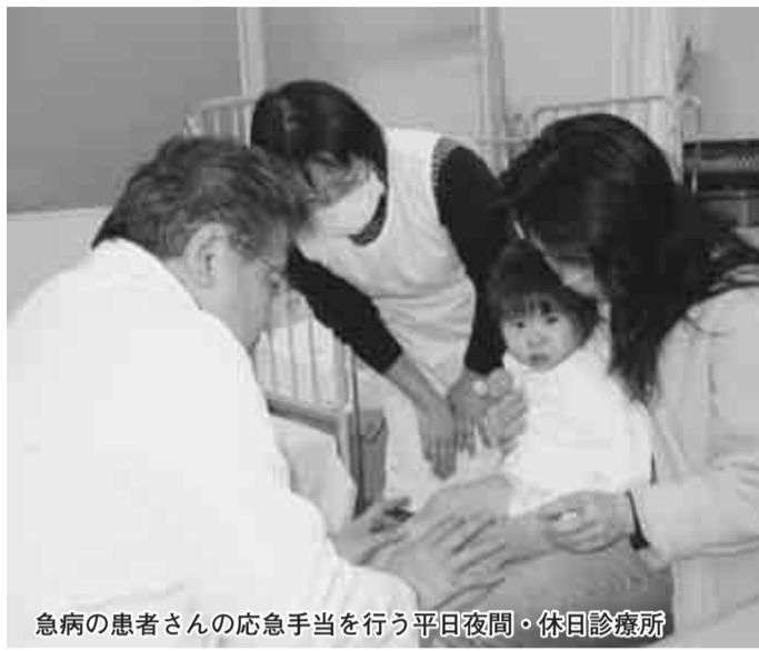
急病の患者さんの応急手当を行う平日夜間・休日診療所