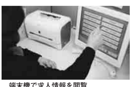
端末機で求人情報を閲覧

【相談日・時間】月・金曜(祝日等を除く)午前8時30分から午後5時までです。※職業相談の流れは、別図のとおりです。詳細は問い合わせを