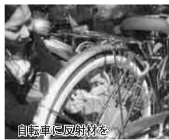
自転車に反射材を

9人増)と全体の4割を超える状況となりました。 こうしたことから、特に高齢者の交通事故防止対策について強化されています。高齢者の巻き込まれやすい交通事故の実態や事故に遭