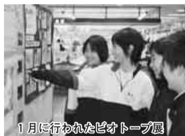
1月に行われたビオトープ展

流山市では、学校の中で自然に親しんでもらおうと平成16年度から19年度までに児童・生徒やPTA、地域の皆さんなどが協働して