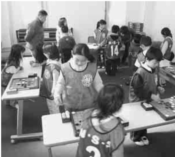
輪になって一手ごとに盤を移動するスクランブルオセロ

流山市青少年相談員連絡協議会では、市内の小学生を対象に「チャレンジゲームin流山」を開催します。 一手ごとに盤を変え、スクランブルオセロや、小学生から募集した市内の名所を読み札にした流山かるたのほか、風船リレーなどみんなで楽しめる一日です。