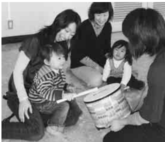
市では、各種子育て支援の助成や手当のほか、子育てサロンなどお子さんを持つ方の交流の場も設けています(8面参照:写真は中央子育てサロン)