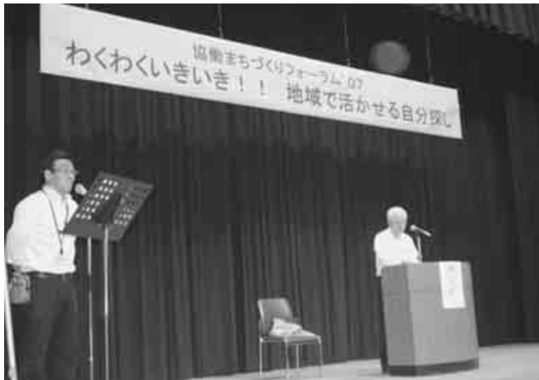
9月15日に行われた協働まちづくりフォーラム'07

流山市民活動団体公益事業補助金を交付した8事業の進捗状況などを確認する中間報告会を開催します。 市民活動推進センター 電話 7150-4355