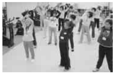
江戸川台東のふれあいホール