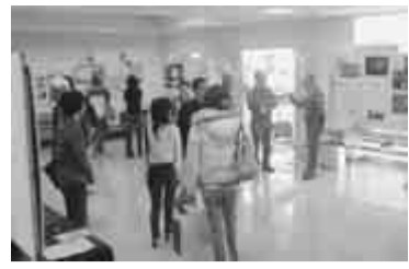
団体のパワーアップを

だこうと「市民活動パワーアップ講座」を開催します。現在、市民活動を運営している方やこれから活動してみようと思