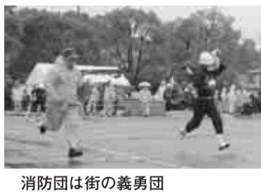
消防団は街の義勇団

9月30日、文化会館駐車場で降りしきる秋雨の中、第16回消防団実戦消防操法大会が行われ、280人の団員が参加し、日ごろの訓練の成果を競いました。 ポンプ車操法の部では第23分団が優勝、準優勝は第19分団、3位は第4分団でした。小型ポンプ操法の部では第16分団が優勝、準優勝は第10分団、3位が第6分団、4位が第9分団、5位が第20分団でした。消防団員の皆さんは、日ごろは自分の仕事を持ちながらいざというときには、消火などに駆けつけるボランティアです。 消防総務課 電話 7158-0299