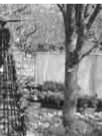
TXやおオオタカをイメージ

人(先着順)▽入場料 無料▽申し込み 当日直接会場へ※駐車場には限りがありますので、流山おおたかの森駅東口からのスクールバスをご利用ください 申込み 2000 7150-6090