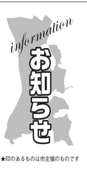
★印のあるものは主催のものです