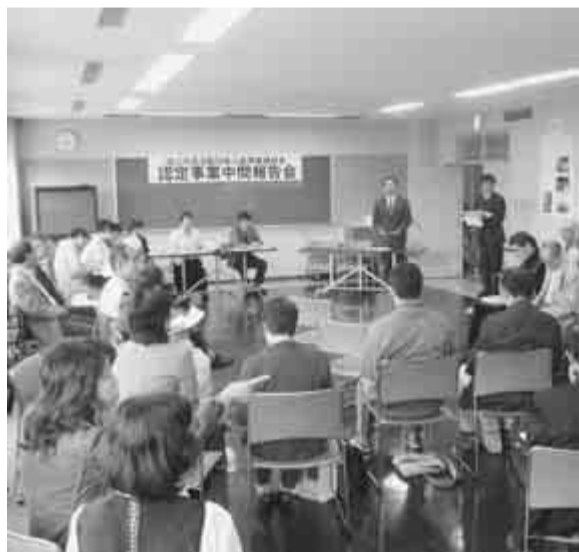
昨年度の中間報告会