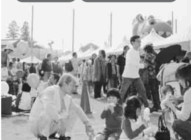
集う喜びを市民まつりで

「第29回流山市民まつり」が11月3日(祝)、総合運動公園をメイン会場に開催されます。また当日は、「福祉まつり」と「市民健康まつり」も同時開催となり、好評の物産展やキヤラクターショー、踊るコーナーなど盛りだくさんな内容です。ぜひ、家族そろってご来場ください。 ▽日時=11月3日(祝)9時30分~15時※雨天決行▽場所=総合運動公園、生涯学習センター