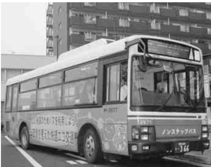
CO2削減のために公共交通機関の利用を

入口「路線を中心に車体にかわいいラッピングをしたバスが運行しているのをご存知です