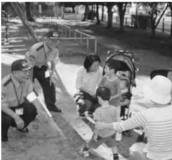
10月から制服もリニューアルしてさらに活躍が期待される市民安全パトロール隊

市では、安心して暮らせるまちづくりのため、「流山市民安全パトロール隊」の隊員としてボランティアで参加