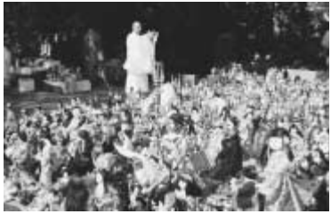
昨年の人形供養会

る「第23回流山人形供養会」を開催します。ご希望の方は、当日直接会場に人形をご持参ください。