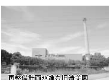
再整備計画が進む旧清美園

次に「汚泥再生処理センター建設工事」の進捗状況については、「汚泥再生処理センター」整備基本計画に基づき、臭気、騒音、排水などに最大限配慮するとともに、周辺と調和した施設とするため、設計・施工一括発注とした、総合評価落札方式で請負業者を選定します。現在、必要な施