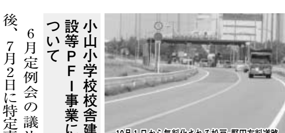
10月1日から無料化される松戸・野田有料道路

今回は、木地区の全域および新市街地区の残りの区域について、土地区画整理事業の円滑な推進と土地利用の促進を図るため、用途地域および地区計画等に関する都市計画手続きを進めます。