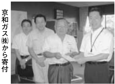
京和ガス(株)から寄付

10時～11時ごろ(受付時間9時～10時30分) ※雨天決行▽場所 成頭寺(駒木224) ※人形はケース等を外してご持参ください。ぬいぐるみ、不燃性の人形は不可 團工商課 ☎7150-6085