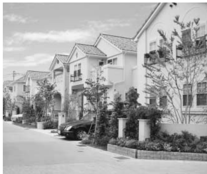
グリーンチェーン等の取り組みを活用し、地域の緑をつなげます

市野谷の森および総合運動公園の緑を核として、街路樹、公園、住宅地や商業地等の緑をつなげ、緑に囲まれた市街地としての景観