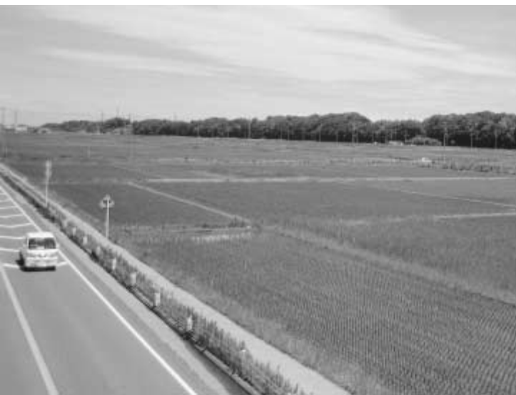
豊かな田園風景が広がる新川耕地

編纂者となられた方には、事前研修を受けていただき、10月から来年2月まで月1〜2回程度の編集会議に参加していただきます。