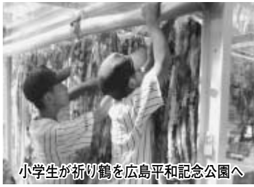
小学生が千羽鶴を広島平和記念公園へ届ける様子

市では、昭和62年に平和都市宣言を行って以来、毎年さまざまな平和施策事業を実施してきましたが、平成16年度からは、市民協働の平和施策事業の一環として、平和への祈りを込めて、市民手作りによる千羽鶴を広島に届ける事業を実施しています。