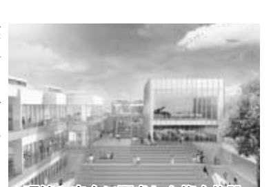
環境や安全に配慮した複合施設

業契約を行い、おたかの森PFI株式会社による基本設計が終了しました。現在、実施設計が行われていますが、入札の際の契約相手からの提案書をベースに、小山小学校の保護者の方々をはじめ、小山小地区社会福祉協議会および学童クラブの運営委員会、現場の教師や子どもたち等を対象にした説明会等を行い、そこで出された意見や要望を踏まえ、利用区分の修正を行いました。