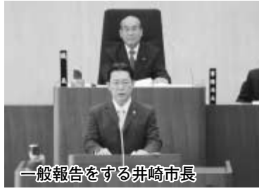
一般報告をする井崎市長

8月30日、平成19年市議会第3回定例会の冒頭、井崎市長は23項目について市政の一般報告を行いました。主な項目を要約して紹介します。なお、掲載した項目以外に「自治基本条例について」「女性議会の開催について」「住民記録等の基幹システムの更新に伴う業者の決定について」「電子入札の実施状況について」「第29回市民まつりについて」「総合防災訓練について」「ヘルスアップ事業応募状況について」「高齢者移動支援事業の登録及び利用状況について」「平日夜間診療所の開設について」「駅前保育施設設置促進事業について」「サマーファンタジア2007と花火大会について」「産業振興審議会の発足について」「景観計画及び景観条例の制定について」「つくばエクスプレス沿線整備事業の進捗状況について」「グリーンチェーン戦略について」も報告しました。