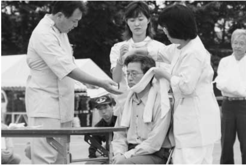
災害時の応急処置など実践力を身に付けましょう

8月26日、西初石小学校で大規模な地震が発生したとき、慌てず適切な行動が取れるように、市では毎年、「総合防災訓練」を行っています。今年、西初石小学校を会場に、8月26日、会場周辺の自治会、警察署、陸上自衛隊などと連携を図りながら開