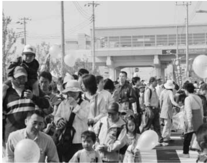
大勢の来場者で賑わった昨年の市民まつり