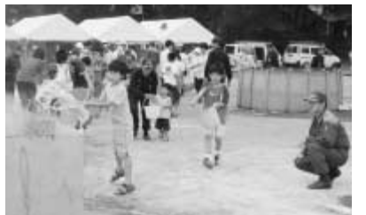
バケツの水で初期消火訓練

催します。当日は、会場までの避難誘導訓練をはじめ、陸上自衛隊の救助訓練、消防署・消防団による火災消火訓練、参加者による消火器やバケツの水を使った初期消火訓練などを行います。会場には、災害時伝言ダイヤルの案内、電気火災の防止方法やガスが使用なくなったときの対処方法などを紹介した展示コーナーを設置。また、起震車や梯子車の乗車体験コーナーなどもあります。災害はいつ起こるか