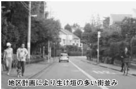
地区計画により生け垣の多い街並み

性に応じきめ細かいルール「地区計画」を地域の皆さんの合意により自主的に定めることができます。