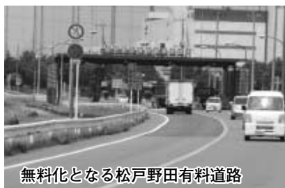
無料化となる松戸野田有料道路

まちづくりのルールを定めるものです。【地区計画によりルール化が可能な例】建築物等の用途/敷地の面積(最低面積)/建物の規模(建ぺい率、容積率)や高さ/敷地境界からの壁面の後退距離/垣またはさくの構造(ブロック塀を禁止し生け垣)など