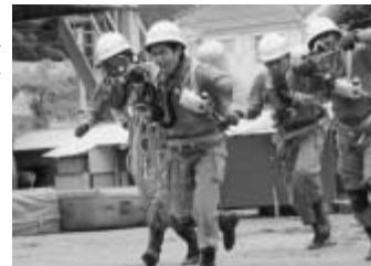
訓練に励むレスキュー隊

前倒ししてまいりました。現在、流山市は、県内でも学校耐震化で先進的な市になってまいりましたが、より市民の皆様にご安心いただけるよう学校の耐震化情報を一覧表にして公開することとしました。 安心して暮らせる流山を皆さんと一緒に築いてまいりましょう。