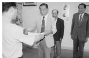
7月25日、流山警察署で

代表)です。市内では、自主防犯パトロール隊38団体が活動しており、市内の刑法犯認知件数は、今年7月末現在で前年同月比6・7%減