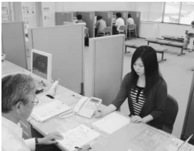
地域職業相談室では、専門の相談員による就職相談や約10万件の求人情報が閲覧できる求人検索システムが利用できます

旧軍人等で恩給等を受けていない恩給欠格者や戦後強制抑留者、引揚者のご本人に、改めて内閣総理大臣名の「特別慰労品」を贈呈しています。 なお、今回は過去に内閣総理大臣名の書状等を受けた方も対象となります。 ※資格要件などの詳細は、お問い合わせください。なお、申請書は市役所社会福祉課で受け取れます 商独立行政法人平和記念事業特別基金 ☎ 120-234-93