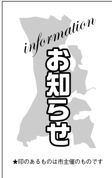
★印のあるものは市主催のものです