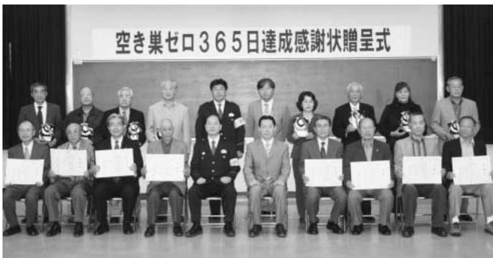
5月30日、防犯パトロール隊8団体に警察署などから感謝状が贈られました