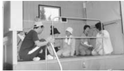
起震車で地震を体感

催します。当日は、会場までの避難誘導訓練をはじめ、陸上自衛隊の救助訓練、消防署・消防団による火災消火訓練、参加者による消火器やバケツの水を使った初期消火訓練などを行います。会場には、災害時伝言ダイヤルの案内、電気火災の防止方法やガスが使用なくなったときの対処方法などを紹介した展示コーナーを設置。また、起震車や梯子車の乗車体験コーナーなどもあります。災害はいつ起こるか