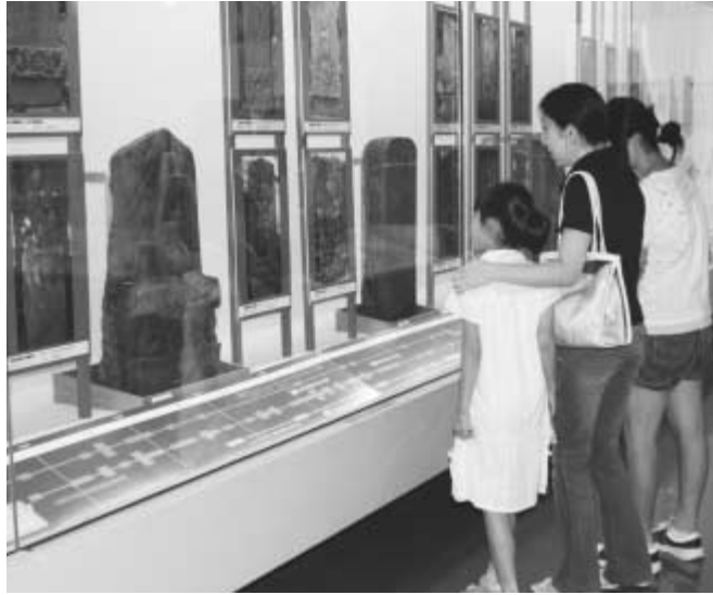
夏休みに自由研究の題材にも

市では、男女共同参画社会の実現に向けて、企画展開催に合わせて、流山の庚申塔を写真と解説で紹介するスライドショー「流山庚申塔散策」を行います。▽期日 8月19日