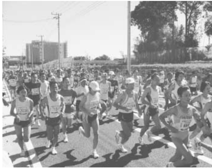
流山ロードレース大会には、毎年大勢の参加者が

記録の更新、完走、健康増進など、自らの目的に合わせて、ぜひご参加ください。 ▽期日▶10月7日(日) ※雨天決行▶スタート時間▶10kmコース:10時、ファンラン2km:10時5分▶受付時間/場所▶8時〜9時(要事前申し込み) / 生涯学習センター▶種目▶