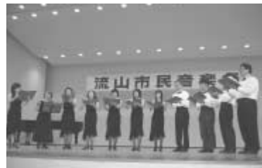
練習の成果を市民音楽祭で