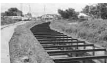
拡幅工事がすすむ大堀川

また、駒木台および青田地域の浸水対策については、大堀川拡幅事業を平成16年度から進めていますが、これ