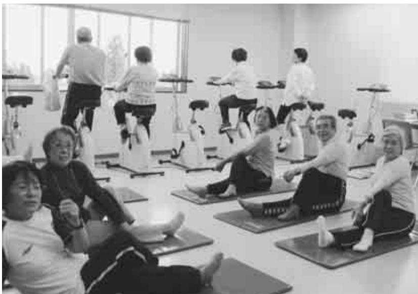
エアロバイクやゴムバンドなどを使って運動が苦手な方も楽しく

市では、今年度から新たに、一人ひとりに適した運動プログラムで体力アップやメタボリックシンドローム(内臓脂肪症候群)の予防・改善をしていただく流山ヘルスアップ事業をスタートします。今回は10月からの参加者を募集します。