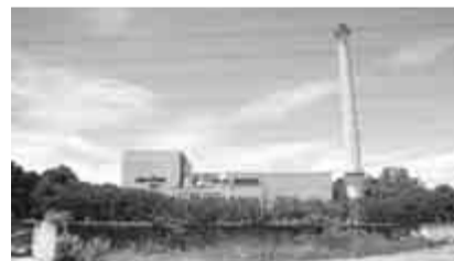
解体予定の旧焼却施設

出された1カ所の周辺を中心に再調査を実施した結果、旧清美園の外周部ではすべて環境