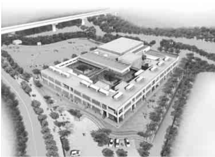
本市初の教育・福祉の複合施設となります(完成予想図)

現在、開会中の市議会第2回定例会で(仮称)小山小学校校舎建設等PFI事業の契約については、審議されています。このPFI事業については、昨年12月1日号の広報なげやまでQ&A方式で特集を組んでお知らせしましたが、今号では、本事業の事業者選定の経緯、事業費内訳、事業者から提案された施設内容等についてお知らせします。PFI事業とは、公共施設などの建設、維持管理、運営などについて民間の資金や経営能力、技