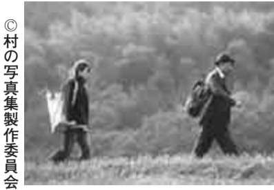
村の写真集製作委員会

文化財発表会 流山市を含む11市が合同で「第5回北西部地区文化財発表会〜昔の人のものづくりテクニックを学ぼう」を開催します。▽展示会=7月14日(土)〜16日(祝)9時〜17時▽場所=鎌ヶ谷中央公民館(三橋記念館)▽入場料=無料 生涯学習課 ☎7150-6106