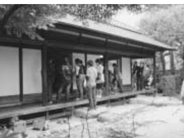
京都という設定の中で一茶双樹記念館がどのように描かれるのか放送をお楽しみに。