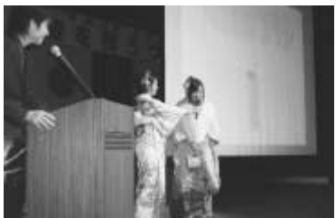
思い出に残る門出の日に

市教育委員会では、来月1月に成人式を迎える市内在住の新成人者を対象に、共に成人としての門出を祝い、一生に一度しかない成人式を、自らの手で創り上げる平成20年流山市成人式実行委員(ポランティア)を募集します。