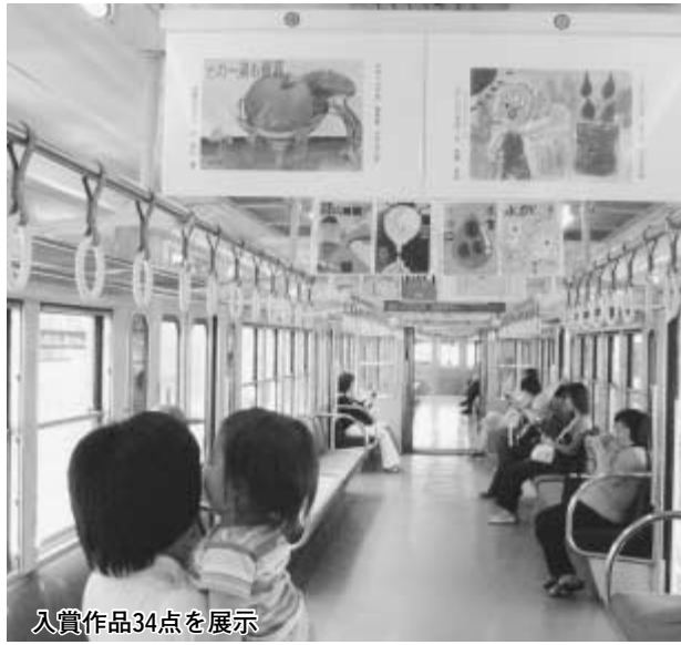
入賞作品34点を展示

私たちの生活に欠かすことのできない「水」。水は、地球の貴重な資源です。きょう1日から7日までは、水や水道への関心や理解を高めたいいただくための「水道週間」です。これに合わせて市水道局では、総武流山電鉄車両内でのポスター展と本年度の「水」のポスターの募集を行います。この機会に、水の大切さについて考えてみませんか。