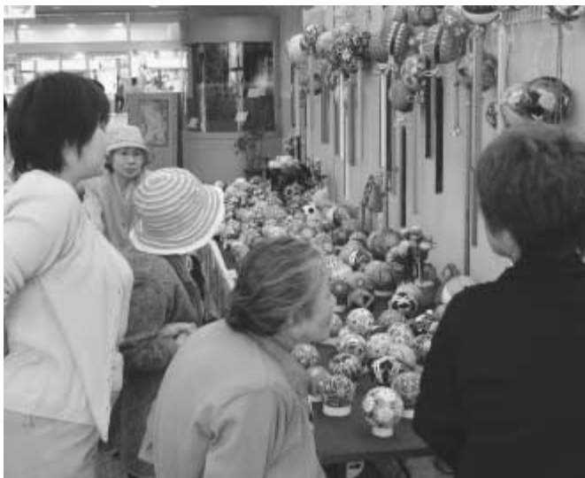
色とりどりの手まりがずらり

〒270-0192 千葉県流山市平和台1-1-1 / 流山市のホームページアドレス ☎04-7158-1111(代表) / http://www.city.nagareyama.chiba.jp/