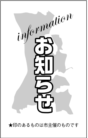
★印のあるものは市主催のものです

②調理実習 ▽期日 6月13日(水)・14日(木)・21日(木)・22日(金)、7月11日(水)・12日(木) ▽時間 10時~13時 ▽場所 南流山センター▽参加費 1回600円(材料代)▽持ち物 エプロン、三角巾、ふきん、デジタルばかり、筆記用具※申込方法など詳細は問い合わせを ▽日時 6月10日(日)13時30分~15時30分 ▽場所 中央図書館▽対象 定員 市内小・中学生とその保護者/20人(先着順)▽内容 貝でつくった縄文時代の腕輪を再現▽参加費 無料▽持ち物 軍手 ▽申し込み 1日9時から電話で博物館へ ▽博物館 ☎7159-3434