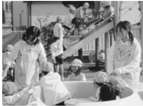
昨年度は544事業所で行われた職場体験学習

ただき職場体験学習が行われました。今年度は、6月から来年度1月にかけて市内5小学校で半日職場見学を、8月から来年度1月にかけて中学2年生の職場体験学習を実施します。 商工会をはじめ、関係機関・団体、事業所等の皆様のご協力をお願いいたします。 Ⅱ指導課 ☎7150-6105