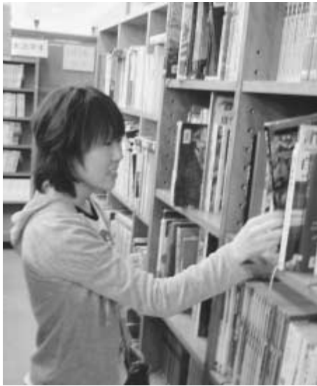
図書館には新しい情報がいっぱい