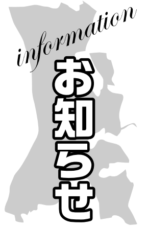
★印のあるものは市主催のものです

料)▽持ち物 筆記用具 ※申込方法など詳細は問い合わせを ☎国保年金課 7150-6077