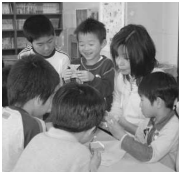
児童館・センターには子どもの笑顔がいっぱい

2・3歳児(4月2日現在)の幼児とその親を対象に、グループ活動を行います。たくさんのお友達が集まって、一緒に楽しく遊びながら地域で子育ての輪をつくるものです。