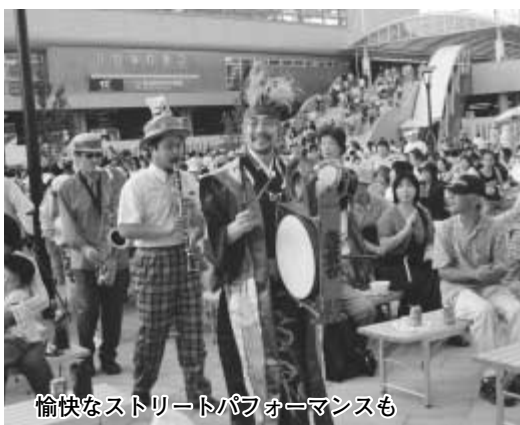
愉快的なストリートパフォーマンスも