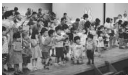
子どもと一緒に楽しめる子育てサロンコンサート

▽期日 5月20日(日) 時間 13時30分～15時 場所 文化会館 入場料 無料 申し込み 当日直接会場へ