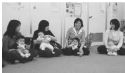
気になることを助産師がアドバイス

▽期日 5月15日・22日・29日、6月5日の火曜 時間 10時～11時30分 場所 文化