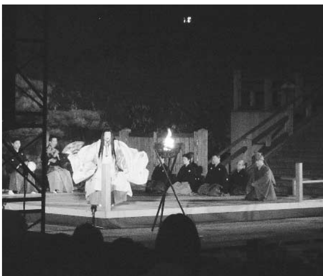
暗闇に浮かび上がる能舞台は幻想的

利根運河の堤に特設の能舞台を設置し、運河を挟んだ対岸に約千席の客席を設けます。水面にかがり火が映る