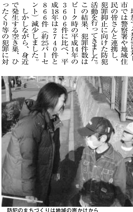
防犯のまちづくりは地域の声かけから

市では、市民が安心して生活できる地域社会を実現するための「(仮称)流山市安心安全なまちづくりの推進に関する条例」の素案を公表し、皆さんの意見を募集します。 増加する犯罪に対し、市では警察署や地域住民の皆さんと連携し、犯罪抑止に向けた防犯活動を行ってきました。この結果、犯罪件数はピーク時の平成14年の3606件に比べ、平成18年は2740件と866件(約25パーセント)減少しました。しかしながら、身近で発生する空き巣、ひったくり等の犯罪に対