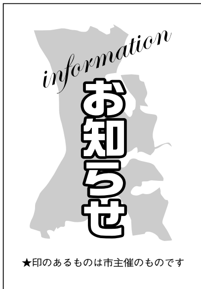
★印のあるものは市主催のものです