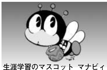
生涯学習のマスコット マナビ