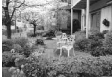
第5回ガーデニングコンテストの入賞作品

市では、「第6回ガーデニングコンテスト」(流山市観光協会、流山造園土木業組合後援)の作品を募集します。