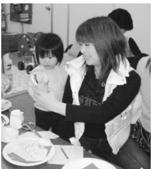
子どもたちの笑顔のために