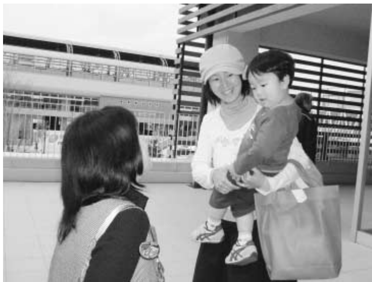
マタニティキーホルダーを見たら皆さんの温かい心配りを