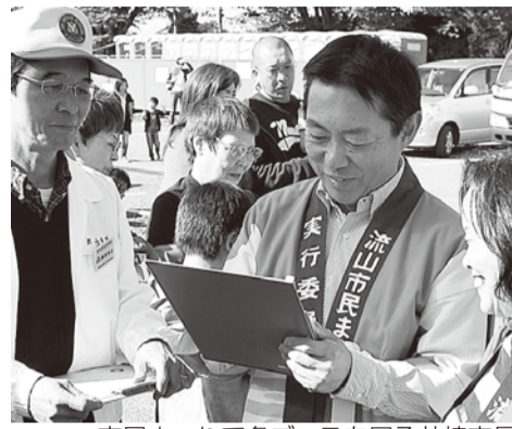
市民まつりで各ブースを回る井崎市長