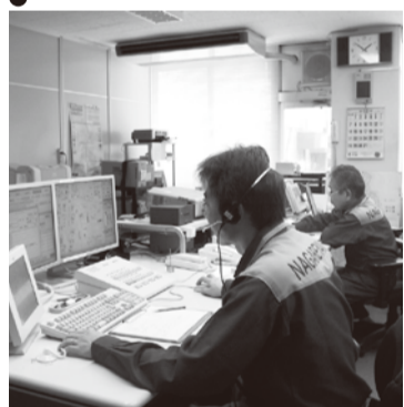
流山市消防本部の指令室

指令業務の共同運用は、平成25年度の開始を目的に、松戸市消防局を主体として整備する市川市、野田市、浦安市、鎌ヶ谷市、流山市の6市及び県北東部と県南部の20消防本部で第1次整備を進めることになりました。この運用により、市境で発生した災害等における各市相互の消防車両の即時運用が可能となります。また、消防救急無線デジタル化についても、平成25年度の消防指令業務共同運用に併せて県域一体での整備を進めています。