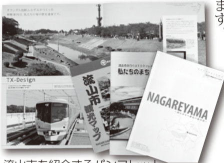
流山市を紹介するパンフレット

また、企業誘致を図る目的で、首都圏を中心に三千社を対象とした企業進出の需要調査を実施しており、集計がまとまった段階で報告したいと考えています。来年度には、市外向け広報活動の充実を図るため、「シテイセールス推進室長」及び「報道官」を民間から公募採用したいと考えています。