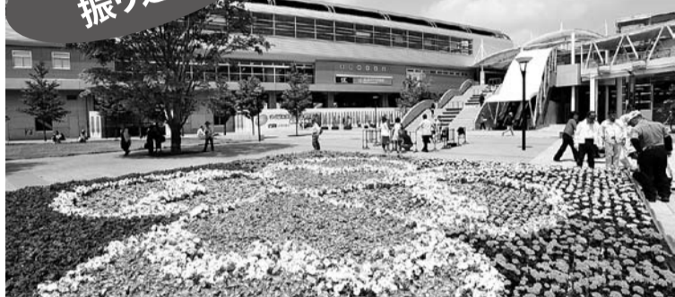
流山おおたかの森駅前広場に市民の参加で作った巨大花絵インフィオラータ(4月)

平成20年も残りわずかとなりました。ことしは市民の皆さんにとって、どのような1年だったでしょうか。本市では、まちづくりの基本理念や原則などを明らかにする「自治基本条例」の案がまとまり、皆さんに公表させていただきました。また、平成22年度から31年度までの10年間の行財政運営の指針となる「総合計画後期基本計画」の策定作業にも着手するなど、10年後、20年後…輝かしい「ふるさと流山」のまちづくりへ向け、しっかりとした足固めができた1年でした。今号では、年の瀬に当たり話題となった出来事など、流山のことし1年を振り返ってみました。