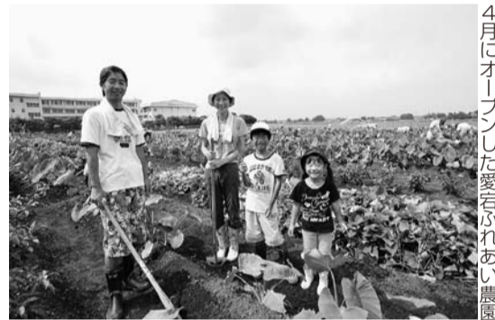
4月にオープンした愛宕ふれあい農園

また、障害者就労施設の「流山こまぎ園」が3月に開設、10月には障害を持つ方の働く場として軽食喫茶「キッチンよつば」が初石公民館にオープンするなど、障害を持つ方も地域で共に暮らす社会づくりが前進しました。