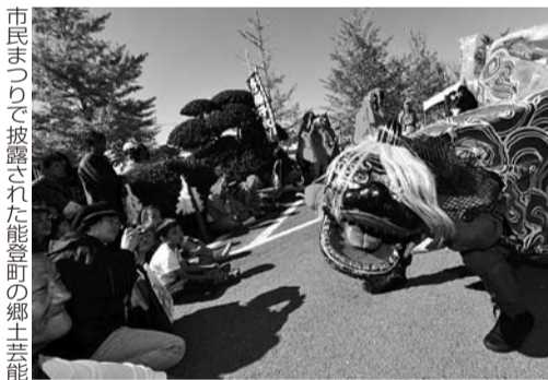
市民まつりで披露された能登町の郷土芸能