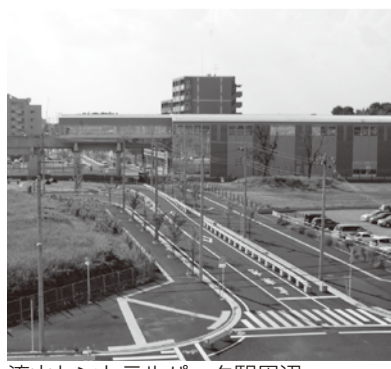
流山セントラルパーク駅周辺

運動公園周辺地区 流山セントラルパーク駅周辺の整備に向けて関係機関との協議を進めています。また、第3回