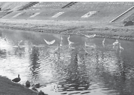
きれいな水環境を残すために