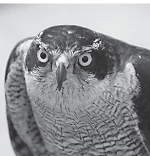
市内でも営巣が確認されているオオタカ