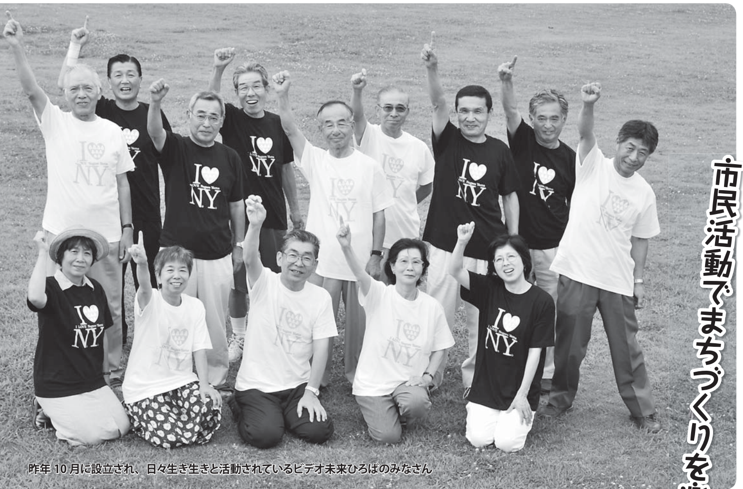
昨年10月に設立され、日々生き生きと活動されているビデオ未来ひろばのみなさん