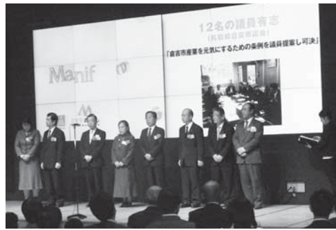
11月5日に六本木アカデミーヒルズで行われた授賞式

となりました。これは、一連の議会改革をベースに、スマートフォンを利用した電子採決など、さらに進化した議会改革を行ったことが評価されたものです。 圖 議会事務局 ☎ 7150-6099