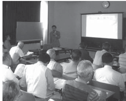
今回は市内4会場で開催