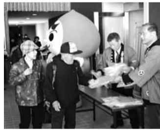
啓発活動や講演会で人権思想の普及を図っています