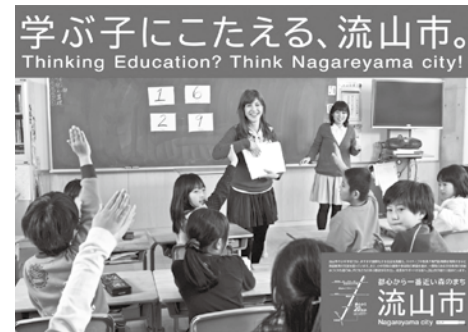
首都圏駅に貼り出されたPR広告