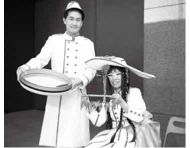
大友さんとおおかさん