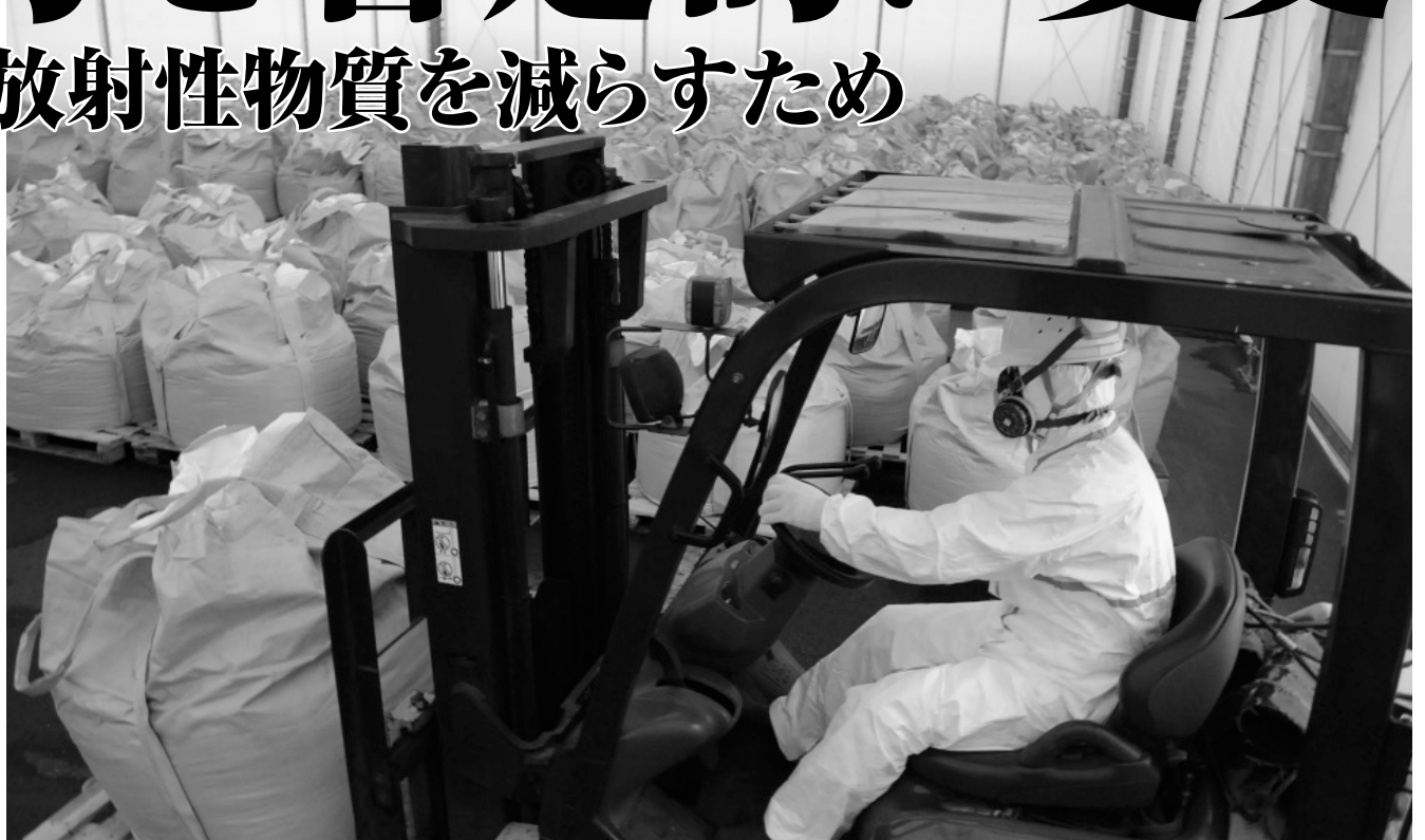
現在、焼却灰はクリーンセンター内で、厳重な管理の下、保管されています。なお、クリーンセンター周辺10カ所の放射線量は毎時0.19マイクロシーベルトから毎時0.48マイクロシーベルトでした。