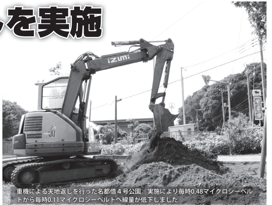
重機による天地返しを行った名都借4号公園。実施により毎時0.48マイクロシーベルトから毎時0.11マイクロシーベルトへ線量が低下しました。

対象:名都借4号公園、前ヶ崎5号公園、駒木台1号公園、後平井児童公園、向小金3号公園、平和台4号公園、前ヶ崎城址公園