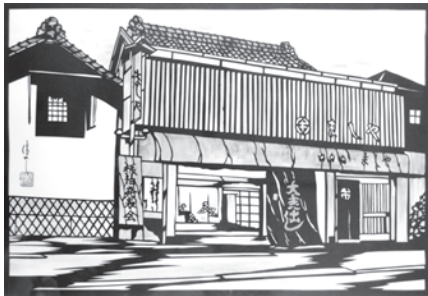
ましや呉服店(切り絵/飯田信義氏)

時代の変化はある。昭和四〇年代はまだ和服が多かったが、いま着物は特別な時だけの衣装になっている。だから、着物を買っても着られないし、手入れの仕方がわからない、という時代になっている。だから、着付けも看板に