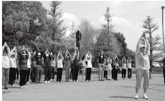
昨年の同フェスティバルでのウォーキング講習会

市教育委員会と市コミュニティスポーツリーダー会では、誰でも気軽に楽しくスポーツ活動に親しみながら、健康・体力づくりと年代を超えた交流を図る「2011コミュニティスポーツフェスティバル」を開催します。