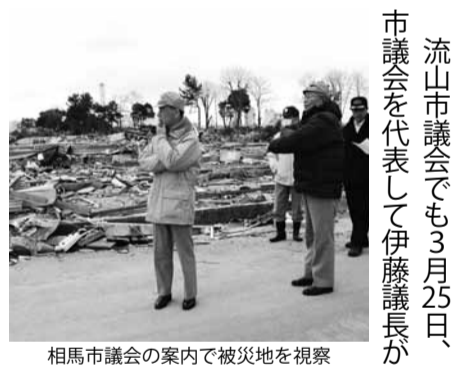
相馬市議会の案内で被災地を視察

皆さんが避難生活を送る避難所を訪れ、お見舞いを申し上げるとともに引き続きの支援を約束しました。