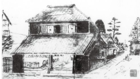
寺田園茶舗見世蔵 (画/寺田英一氏)

見世蔵へ入ったら立派な赤松の梁材を見てほしい。これが見世蔵の屋台骨、私は長寿(百二十一歳)の秘訣を梁に見た。ケヤキの柱はお洒落な杢石をはいている。土蔵造りと言われる通り、漆喰の厚さは30センチ、腰回りは冷えるのか40センチ近い。