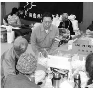
相馬市の避難所を慰問

津波により被害を受けた市内の状況をはじめ、工業、農業、漁業などの各産業への深刻な災害の痕跡を視察しました。