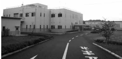
森のまちエコセンター (ここのす台1594)

問 森のまちエコセンター ☎7154-5736 リサイクル推進課 ☎7157-8250