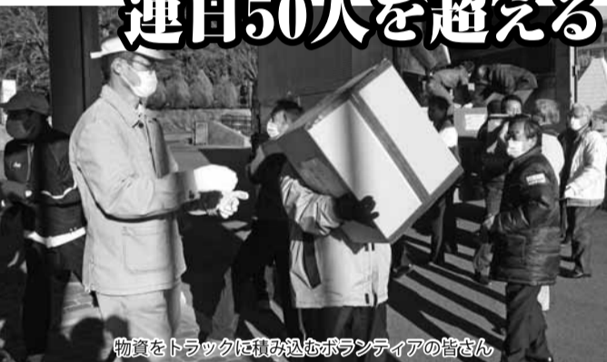
物資をトラックに積み込むボランティアの皆さん

震災発生翌日の3月12日から4月5日までに、相馬市への支援物資の輸送は合計16便となりました。3月19日からは、市民の皆さんからの物資も受け付け、衣類や食料品、さまざまな日用品などが送られました。また、物資を受け付けたコミュニティプラザでは、連日50人を超えるボランティアの方々が仕分け作業やトラックへの積み込みを手伝って下さいました。さらに、相馬市への物資の輸送についても、市内の運送会社がボランティアで担当。市民の皆さんの善意が、支援の輪を大きく広げています。