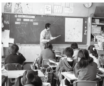
コンパスを使った作図の面白さを学びました

このような活動を通して、中学校での学習に一層の期待と興味を抱くことをねらっています。 指導課 ☎7150-6105