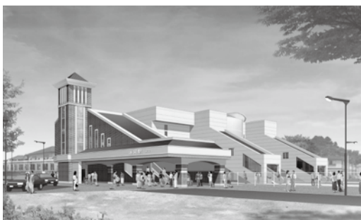
駅橋上化の歩行者専用通路など、整備されています。

近隣の方や駅を利用される皆さんには引き続きご迷惑をおかけしますが、ご理解ご協力をお願いします。 ☎ 都市計画課 ☎ 7150-6087/まちづくり推進課 ☎ 7150-6090