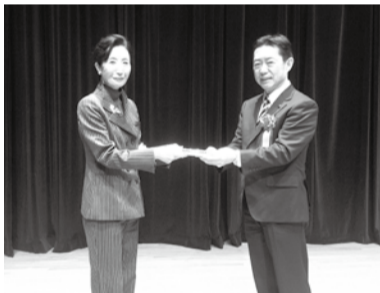
3月13日に授賞式が行われました

今回、自治体として受賞したのは流山市だけで、過去には青森県・武蔵野市・三鷹市・佐倉市・浜松市の5自治体が受賞しています。（5面に関連記事） 注：企業・団体などが組織活動のために、施設とその環境を総合的に企画、管理、活用する経営方法。