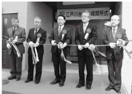
開所を祝うテープカット