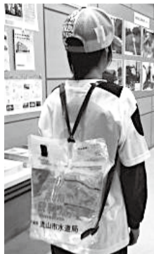
応急給水用水袋はリュックのように背負うことができます

市内の4つの浄水場で給水するほか、8カ所の小学校（注）に応急給水所を開設します。市民の皆さんが応急給水所から持ち帰りやすいように、背負うことができる容量6リットルの応急給水用水袋を用意して配布を行います。