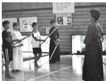
初めて竹刀を握り、打ち方を学びました