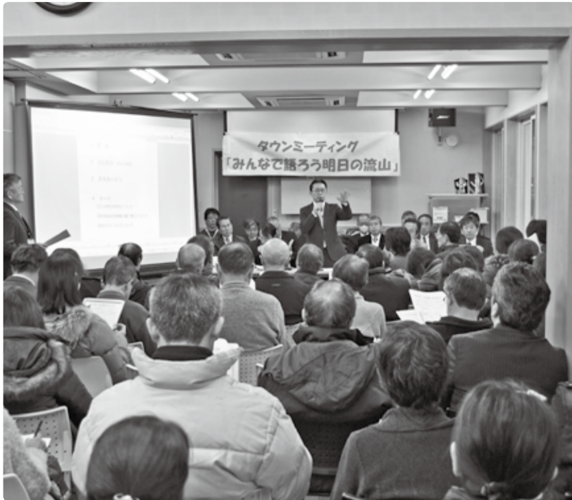
江戸川台西自治会館(=写真)、向小金福祉会館、水道局、南流山センターの4カ所で実施したタウンミーティング

なお、タウンミーティングでは、市民総合体育館の建て替え事業についても議題とし、ご意見・ご質問をいただきました。これらのご意見の要約がまとまりましたので、お知らせします。