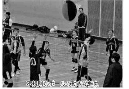
不規則なボールの動きが魅力

ヘルスパレーボールは、子どもから中高年者まで気軽に親しめるスポーツとして、昭和53年に流山で考案された軽スポーツ。使用する楕円形のヘルスパレーボールが予測不能な動きをし、本来のバレーボールとは一味違った面白さを体験できるのが魅力です。