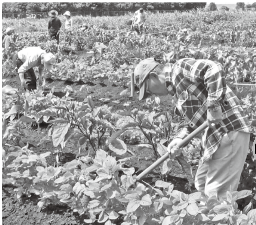
愛宕ふれあい農園で農作業に汗を流す皆さん