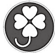
肢体が不自由な方が運転する車に表示するマーク