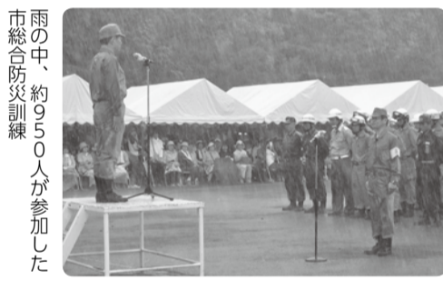
雨の中、約950人が参加した市総合防災訓練

昨年3月11日に発生した東日本大震災に伴う福島第一原発の事故の影響で、本市を含む東葛地域で比較的高い放射線量が測定されました。市では、学校や幼稚園など子どもが多く利用する施設の除染作業を最優先とし、今年8月末に作業を完了しました。なお、公園については全体の約6割が除染作業を終えており、残りの公園については現在も作業を進めているところです。住宅地の除染については、お申し込みいただいた5,391件のうち、11月末現在で5,156件の測定を終了しています。除染対象となった住宅は1,586件で、うち線量が高い66件の除染作業が終了しました。本年度中に対象となった住宅の作業を完了する予定です。