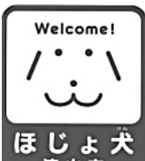
身体障害者補助犬同伴の啓発のためのマーク