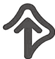
聞こえが不自由な方を表示するマーク

障害をおもちの方に関するマークをご存じますか。見たことはあっても、内容が正しく理解されていないものが あります。マークを見かけたら、ご理解・ご協力をお願いします。 マークの詳細は、市ホームページをご覧ください。 問 障害者支援課 ☎7150-6081 ID 12800