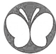
聴覚障害の方が運転する車に表示するマーク