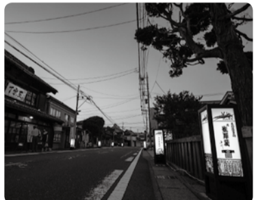
本町界隈の行灯が昔ながらの風情を醸し出す

4月26日に新東谷調整池・新東谷防災広場、同月29日には東部地区に木の図書館がオープンしました。新東谷調整池は南流山地区の浸水対策として整備され、池底部は地域コミュニティの場所としてテニスコートが整備されています。木の図書館はその名前のとおり木の温もりを活かした図書館で、太陽光発電設備や雨水利用など環境に配慮した施設となっています。 流山本町には一昨年オープンした万華鏡ギャラリー見世蔵に続き、4月5日にイタリアンレストラン「丁字屋」とベーカリー「蔵日和」、11月1日には蔵のカフェ+ギャラリー「灯環」がオープンしました。いずれも明治から大正時代の建造物を改装し、貴重な歴史的建造物を守りながら新たな魅力として再生したものです。本町界隈には歴史の面影を持つ建造物とともに切り絵をあしらった行灯が地元の方々により設置され、淡い光が街並みに趣を添えています。「流山が一番古くて新しいまち」として、今後より一層の賑わいが期待されるスポットとなりました。