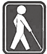
目の不自由な方のための世界共通のマーク