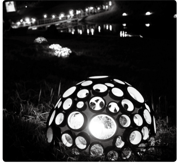
利根運河の夜を幻想的に演出した、東京理科大学主催のシアターナイト2012(10月)