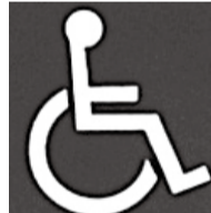
車いすの方だけでなくすべての障害者が利用できる施設に表示するマーク