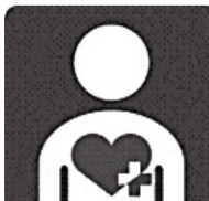
身体内部(心臓、呼吸機能など)に障害のある方を表示するマーク