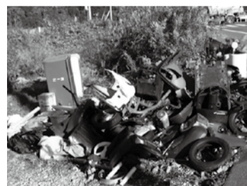
法律で厳しく罰せられます