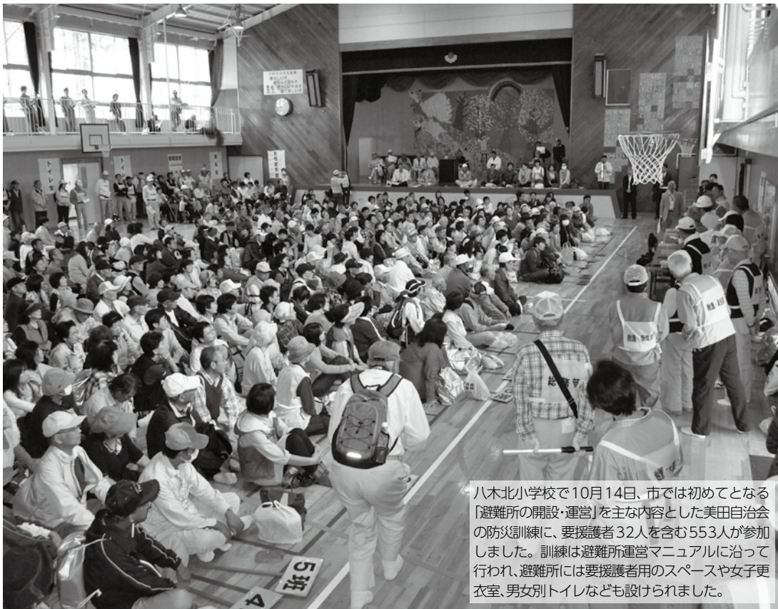
八木北小学校で10月14日、市では初めてとなる「避難所の開設・運営」を主な内容とした美田自治会の防災訓練に、要援護者32人を含む553人が参加しました。訓練は避難所運営マニュアルに沿って行われ、避難所には要援護者用のスペースや女子更衣室、男女別トイレなども設けられました。