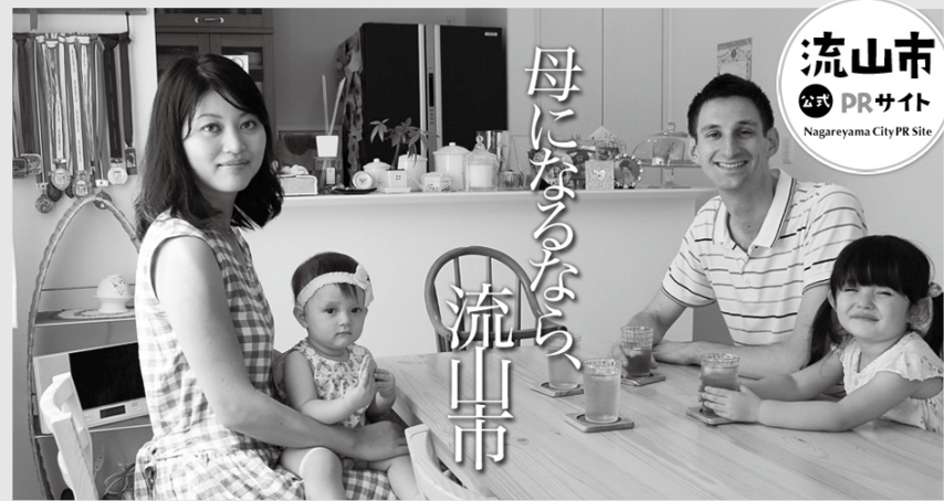
PRサイトイメージ。モデルは太田区田園調布から移り住んだクリスさんご家族