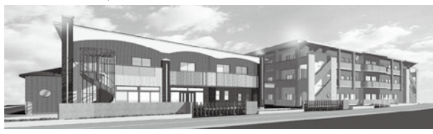
右側の建物が月の船。左側は併設の幼稚園(完成予想図)

問開設準備室 ☎7178-33377 URL http://www.akagimanyo.com/