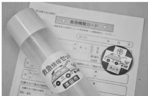
救急情報カードを記入し冷蔵庫に保管