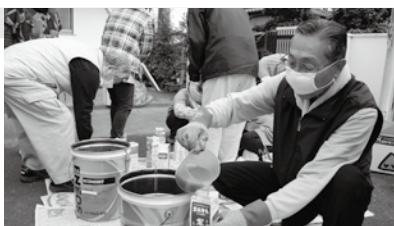
環境にやさしいだけでなく、汚れもよく落ちます。

廃油から環境にやさしい石けんをつくります。 日11月8日(木)10時～12時※雨天時は9日(金) 所南福祉会館 定30人(先着順) 申電話で南福祉会館へ 関南福祉会館☎7155-3160