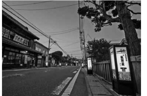
街道に並ぶ行灯 (撮影のため並べたものです)

ぐ足をちょっとゆるめて、行灯の光に浮かぶ切り絵の風情をお楽しみください。行灯についてのお問い合わせは、市役所商工課(☎7150-6085)まで。