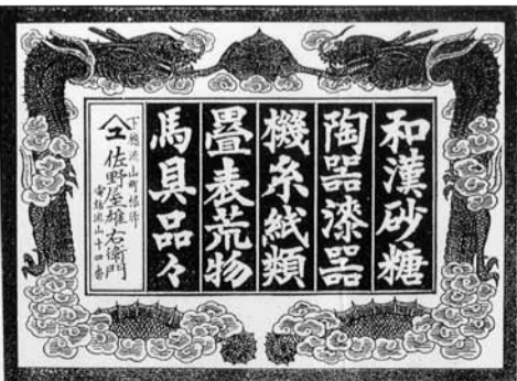
佐野屋の引き札 (広告) 明治時代のものか

それは火伏せのお守りのような物だったらしいと、包みを開けてみてはじめてわかつた。田植えの季節に店にはミノ、すげなど下がついていた。砂糖、瀬戸物、ろうそく、麻縄、たばこ、マッチ、機糸、馬具まで売っていた。お客は八木や新川はもちろん、柏や三郷からも来た。