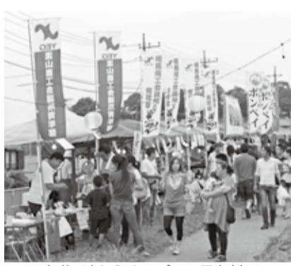
午後4時からオープンの屋台村

馬市のブースも出店予定です。さらに、有料観覧席内の本部テント前の特設ステージでは、18時からジャズと和太鼓による「リバーサイドコンサート」を開催します。