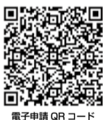
電子申請 QR コード