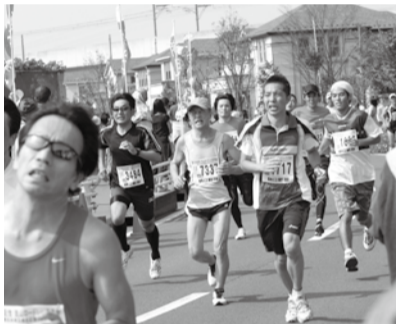
昨年は約2,900人が参加