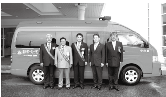
同クラブ創立25周年記念式典でキーが手渡されました。