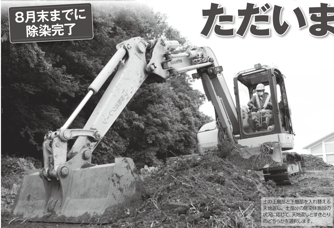
土の上層部と下層部を入れ替える 天地返し。土部分の除染は施設の 状況に応じて、天地返しとすきとり のどちらかを選択します。

市では、流山市除染実施計画に基づき、子どもが多く利用する施設(注)を最優先に除染作業を進めています。除染を効率的に行うため、委託業者と調整したスケジュールに沿って行っており、8月末の完了を目指しています。今号では、各施設の除染開始時期をお知らせします。