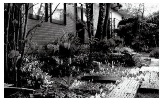
昨年のガーデン部門金賞

も可。合成などの加工したものは不可。※応募写真の著作権は主催者に帰属し、応募写真は返却しません。日応募締切=6月29日(必着)※応募方法など、詳細はお問い合わせください。 日みどりの課 ☎7150-6092