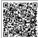
携帯電話電子申請 QRコード

①住所 ②氏名(ふりがな) ③性別 ④生年月日 ⑤電話番号 ⑥希望する検診の種類を明記の上、☎270-0121流山市西初石4-1433-1保健センターへハガキで郵送またはファクスまたは電子申請でお申し込みください。※保健センター窓口でも可。電話では受け付けていませんのでご了承ください。