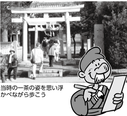
当時の一茶の姿を思い浮かべながら歩こう

小林一茶が、生涯にたびたび訪れた流山周辺での一茶の足跡をたどるウォーキングです。馬橋から一茶双樹記念館への約9.1kmの行程を、一茶双樹記念館オリジナル古道地図『下総葛飾今様小金道絵図』を手に歩きます。コース上の主なポイントでは、流山市史跡ガイドの会の方によるガイドもあります。