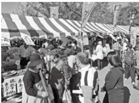
第35回流山市民まつり

10月27日、市総合運動公園を会場に、市民まつり実行委員会主催による市民まつりと市民健康まつりが開催されました。今年は、従来の姉妹・友好都市の物産展などに加え、新たな試みとして、ステージ関係の催しを地元ケーブルテレビとタイアップして構成し、市民による音楽やダンスの出演などの模様を同時放映しました。また、来場者の利便性を図るため、宅配業者による配達サービスや荷物の一時預かり所が開設され、秋晴れのなか、昨年を大きく上回る3万3千人の来場者で賑わいました。