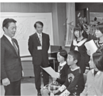
11月21日の防犯ポスター表彰式にて

11月28日、平成25年市議会第4回定例会の冒頭、井崎市長は15項目について市政の一般報告を行いました。そのうち主なものを要約して紹介します。