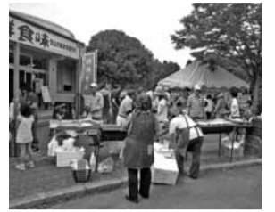
今年6月に行われた夏まつり

日 12月22日(日)10時～13時30分※雨天中止 所 農産物直売所「新鮮食味」(コミュニティプラザ内) 図 新鮮食味 ☎7155-7015