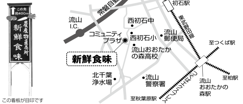
この看板が目印です