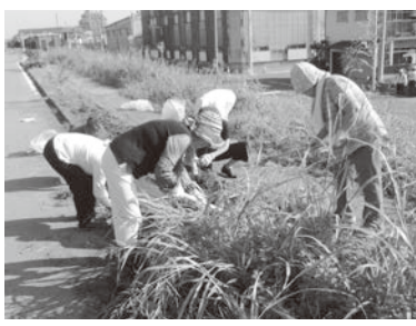
「流山3丁目の景観と花と緑を育てる会」の皆さん=写真。「おもてなしの心」で江戸川の土手沿いの植栽帯の美化に取り組んでいます。