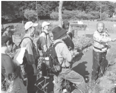
屋外でのセミナーも

☎文化会館 対すべての日程に参加できる方 講NPO法人流山史跡ガイドの会の皆さん 定30人(先着順) 費500円(テキスト代含む) 申12月20日までに電話 ☎文化会館 ☎7158-3462 ID 19348