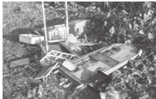
人目につきにくい場所などで多く発生