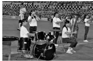
昨年は八木中の生徒が演奏

柏レイソルでは、「流山ホームタウンデー」として、8月28日の対湘南ベルマーレ戦に市内小学生を無料招待します。