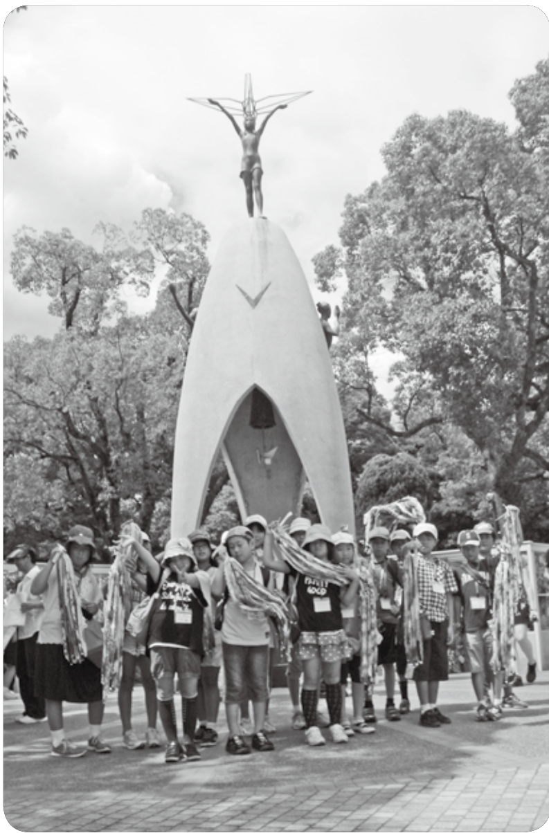
昨年、約17万9千羽の折り鶴を広島へ届けた平和大使

流山市では昭和62年の「平和都市宣言」を受け、さまざまな平和施策を展開してまいりました。平成16年から始めた「平和を願う千羽鶴」を広島へ届ける事業は、今年で10年目となり、今までたくさんの方の想いを届けてきました。今年も公募によって選ばれた15人の小学生を「平和大使」に任命し、皆さんから寄せられた手づくりの千羽鶴と平和への想いを広島へ届けます。 平和大使は、千羽鶴の献納、平和記念式典への参加、袋町小学校平和資料館の見学や被爆者のお話を通して、原爆の恐ろしさや平和の尊さについて学びます。平和について後世に語り継がなくてはならないことがたくさんあります。この機会に、平和の大切さについて考えてみませんか。