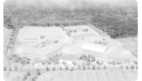
このイメージは平成24年8月の基本設計完了時のものであり、現在修正をしています(9月ごろ公表予定です)。