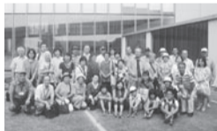
昨年は江東区の施設を見学