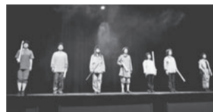
昨年の参加者も舞台経験のない方が中心でしたが、「注文の多い料理店」の舞台を演じ切りました。