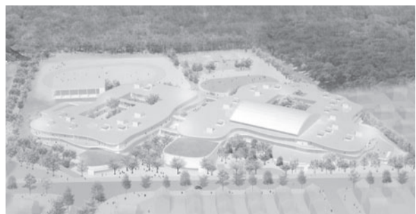
このイメージは平成24年8月の基本設計完了時のものであり、現在修正をしています(9月ごろ公表予定です)。

施設整備費 労務単価の上昇等により増額 平成25年3月に国土交通省が、公共工事設計労務単価を引き上げたこと(全国平均15.1%)等により、施設整備費が約10億5千万円の増額となりました。