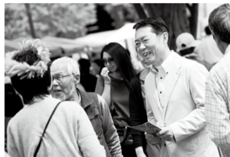
グリーンフェスティバルで市民の方とふれあう井崎市長

昨年10月30日に損害賠償請求をした焼却灰保管費用2億3447万9883円のうち、未払いとなっていた溶融飛灰薬剤処理装置設置工事費や焼却灰処理に伴う人件費など合計1億5065万61