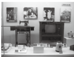
ミシンやテレビなどの懐かしい道具や写真を展示

毎年恒例となったこの企画展は、昔の道具や写真などの展示品が「懐かしい」「実際にさわって体験できるものがある」と好評で、小学生の調べ学習にも役立つように分かりやすく展示します。今と比べると不便に思える昔の暮らしですが、わたしたちの暮らし方を見直そうとするときのヒントをたくさん見つけられるかもしれません。実際に展示品を見て、ちょっと昔の暮らしに思いをはせてみませんか。