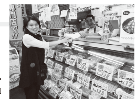
肉の太田屋の店主との会話も楽しい

いつもここ、平和台銀座通り商店会のお肉屋さんを利用しています。とにかくお肉がおいしくて、子どもたちも大好きです。お付き合いが長いので、好みや家族構成を分かった上で、その日のおすすめや調理法についてアドバイスをもらっています。そうしたところが、個人商店の良いところですね。若い方の中には個人商店に入りにくいとおっしゃる方もいますが、ぜひ一度利用してみてください。