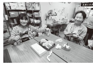
地元産の綿を使った糸紡ぎの講習会なども開催