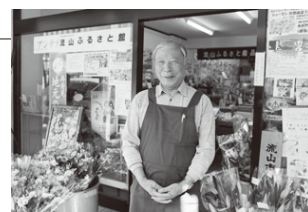
店の前に並ぶ生花も流山産

特産品は、地方への発送もしていますので、お中元やお歳暮にもご利用ください。お好きな商品の詰め合わせも可能です。店舗の奥には市民の交流の場として利用できるスペースもあります。どうぞお気軽にお越しいただき、流山の魅力を再発見してください!